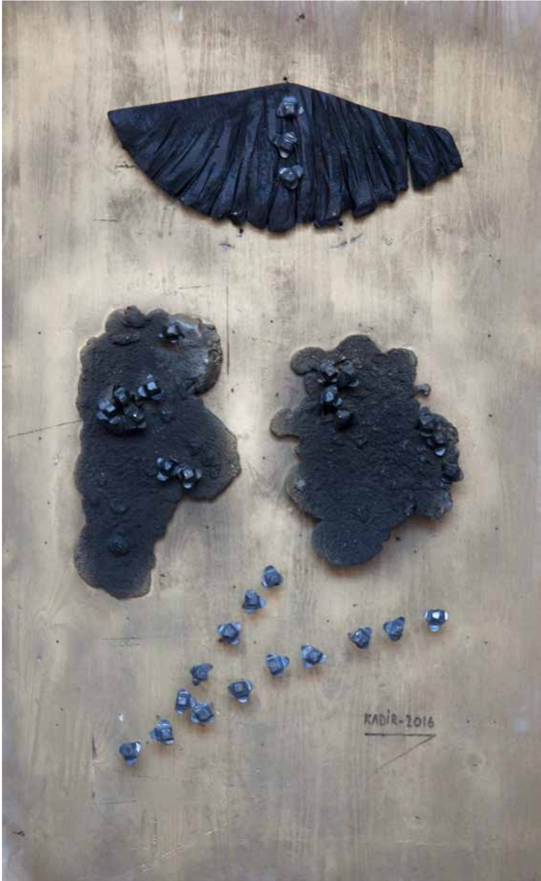
“Portrelerin Bakışı”, 80 x 50 x 6 cm, Metal-Ahşap Pano, 2016