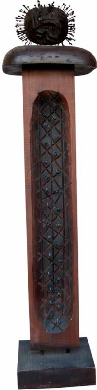
“Çivili Baş İdol”, 175 x 35 x 32 cm, Maun, 2013