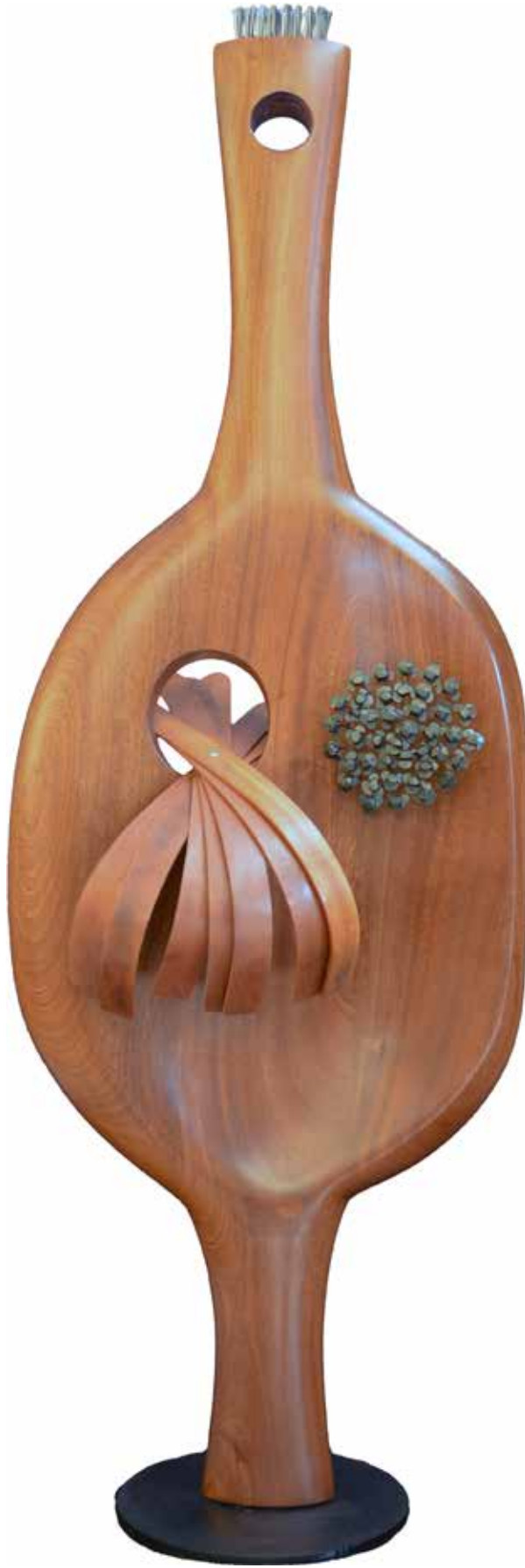
“Ananın Bekleyişı”, 165 x 55 x 50 cm, Maun, 2013