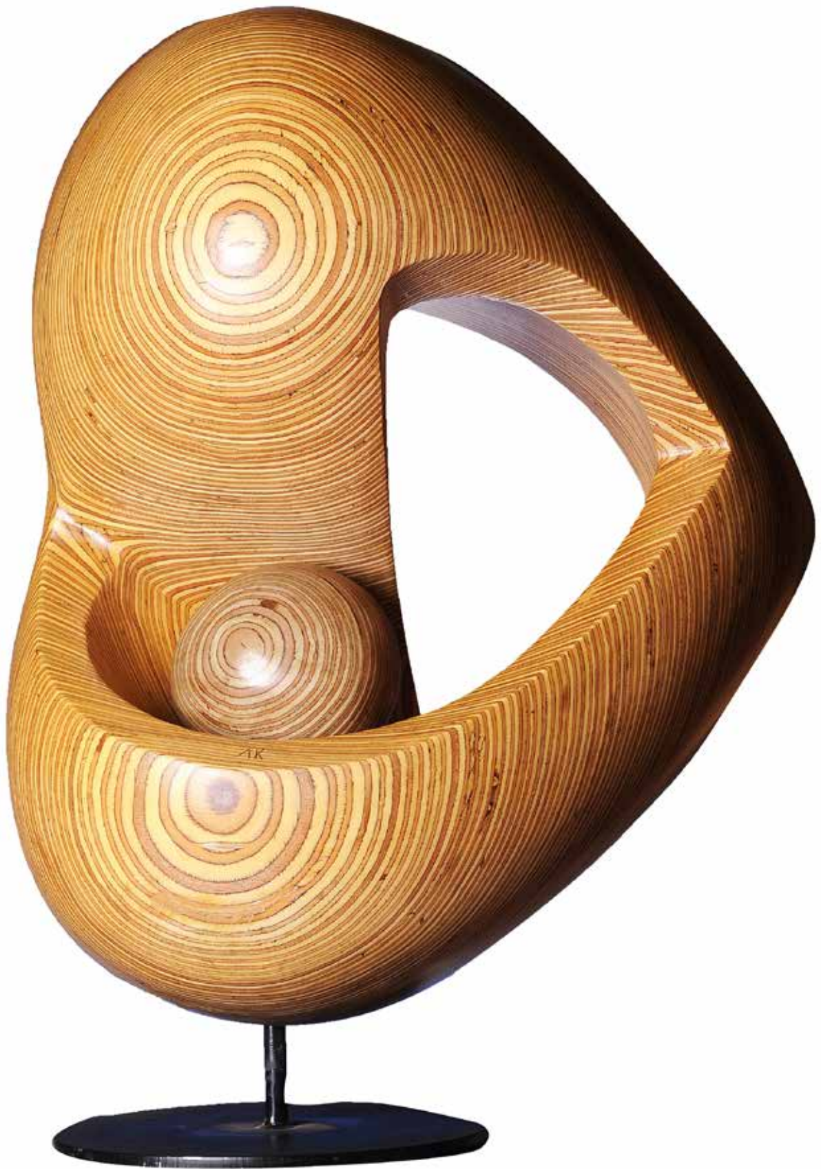
"Formun Yaşamı", 80 x 58 x 36 cm, Ahşap, 2013