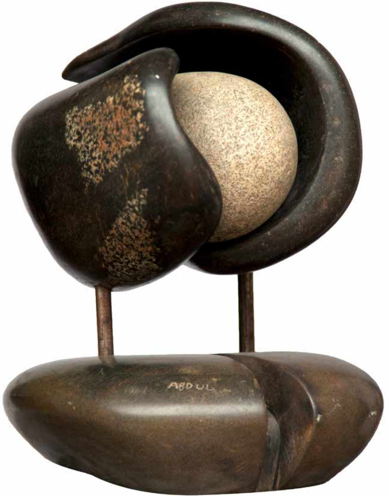
"İç Dünyamızda Yaşamak", 31 x 33 x 22 cm, Serpantin, 2004