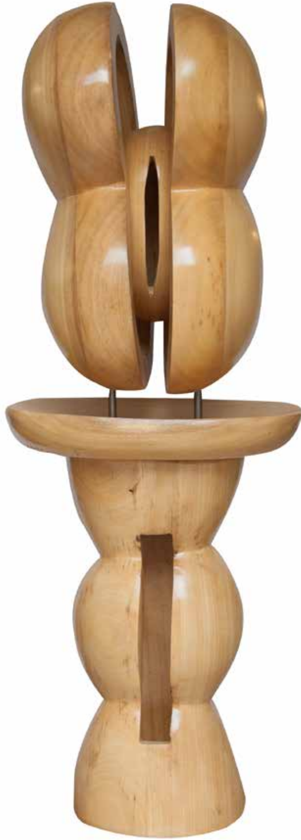
“Çatlattan Oluşum”, 164 x 57 x 51 cm, Ayos, 2016