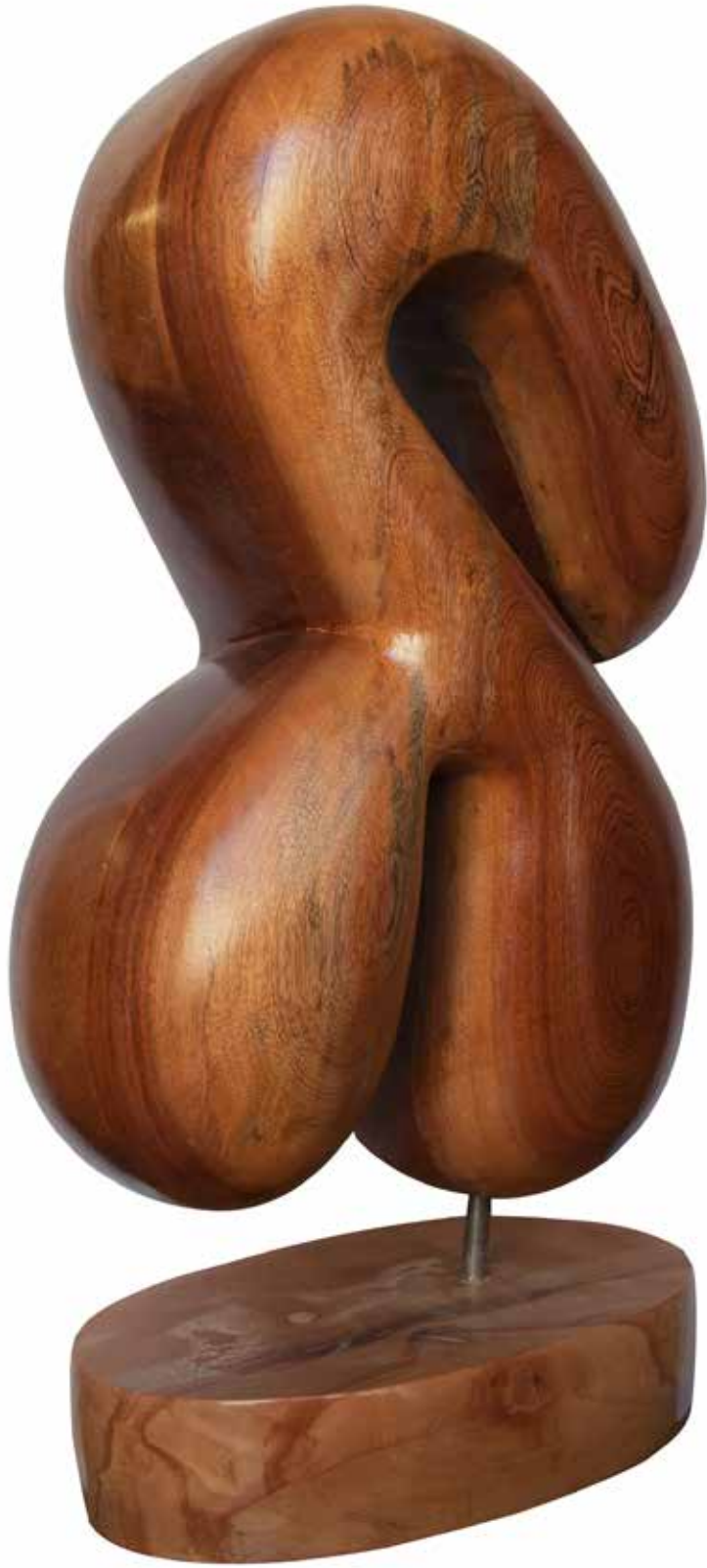
“Dönüşüm”, 86 x 41 x 28 cm, Maun, 2014