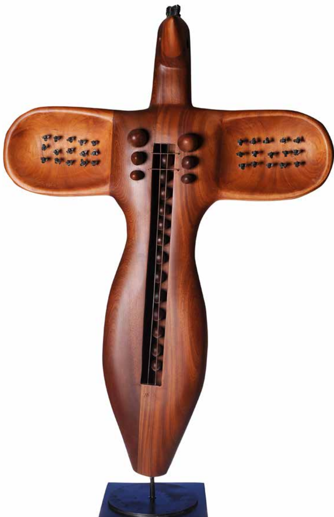
“Mitolojik İdol”, 165 x 110 x 28 cm, Maun, 2014