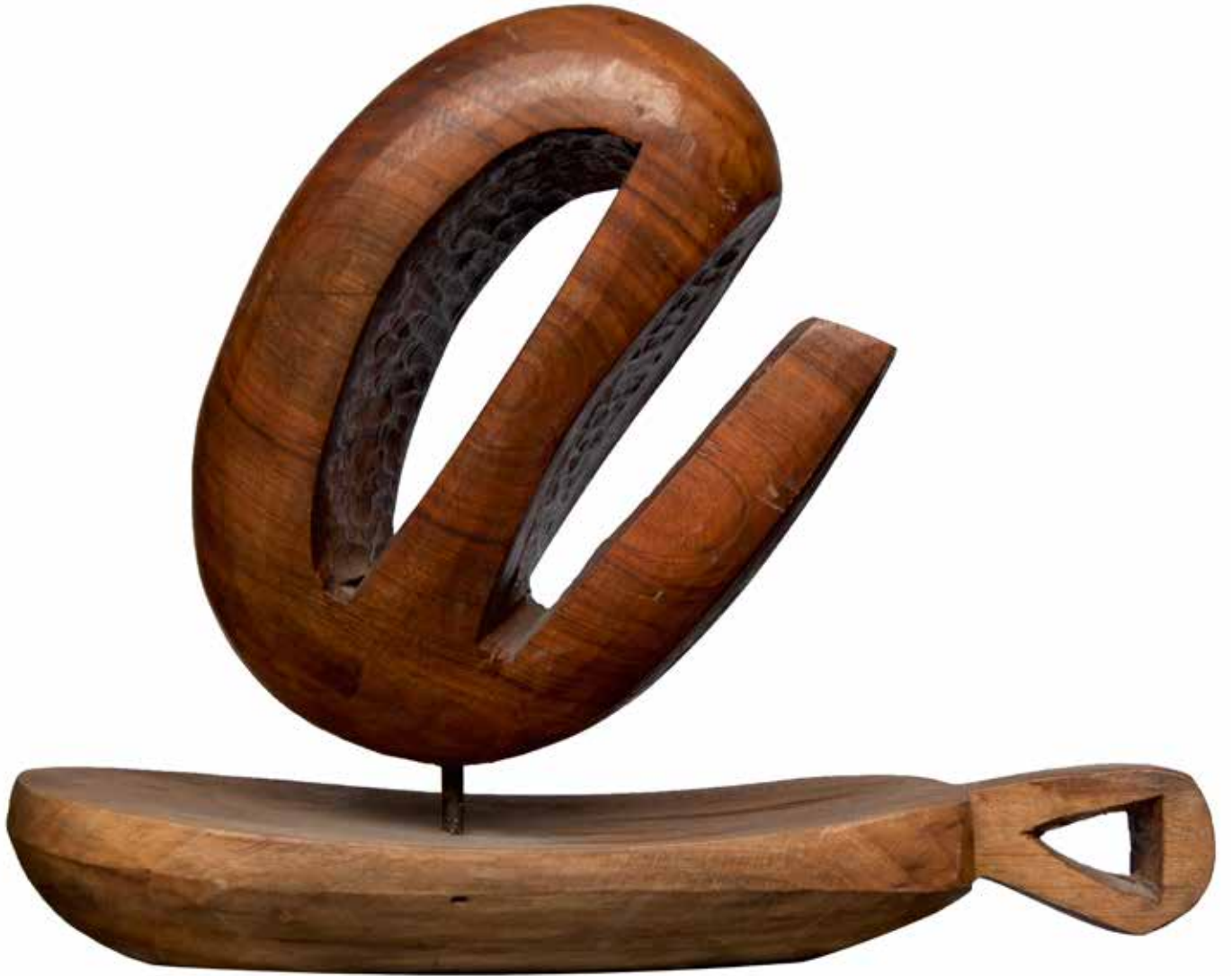
“Farklı Yaşamak”, 43 x 52 x 19 cm, Çeviz, 2002