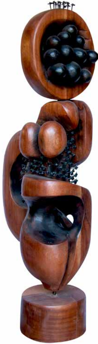
“Masal İinde Yařamak”, 150 x 50 x 37 cm, Maun, 2014

Ön Kapak: “İdol İinde Doğmak”, 199 x 66 x 35 cm, İroko, 2016