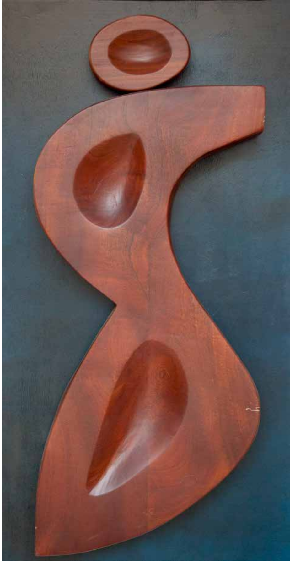
“Nu'deki Yalnlık”, 122 x 65 x 14 cm, Maun Pano, 2013