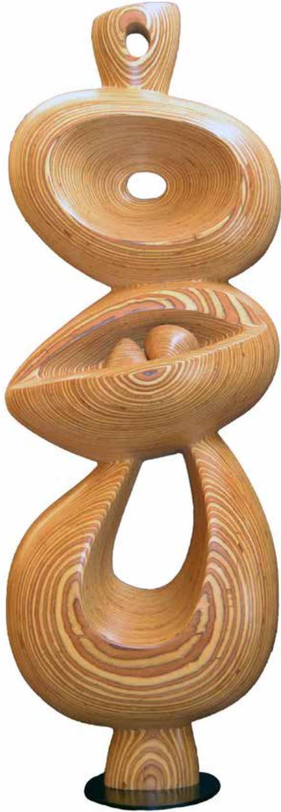
"Katlı İdoller", 175 x 60 x 42 cm, Ahşap, 2013