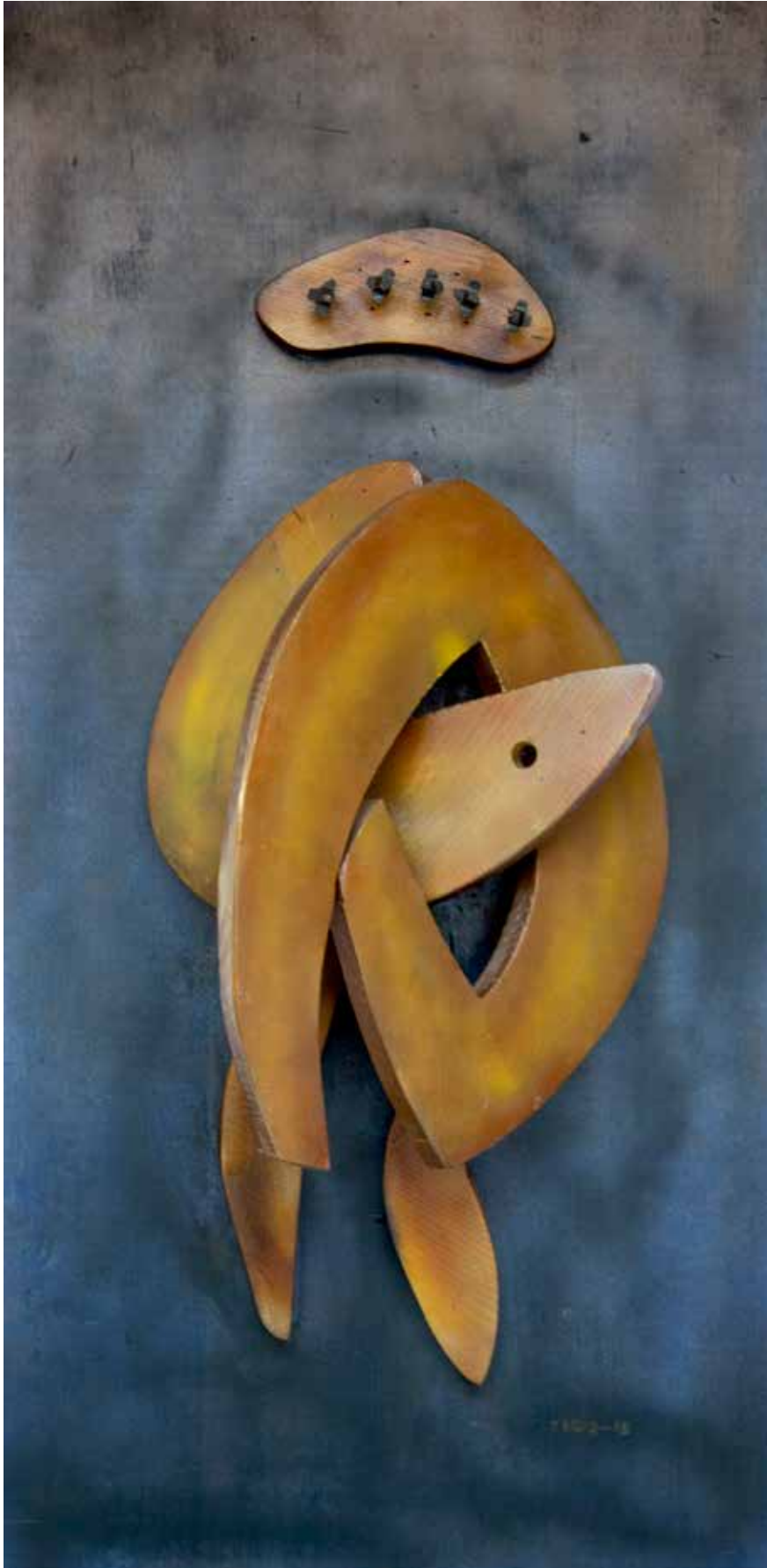
“İç İçe Formlar”, 120 x 60 x 25 cm, Ahşap Pano, 2015