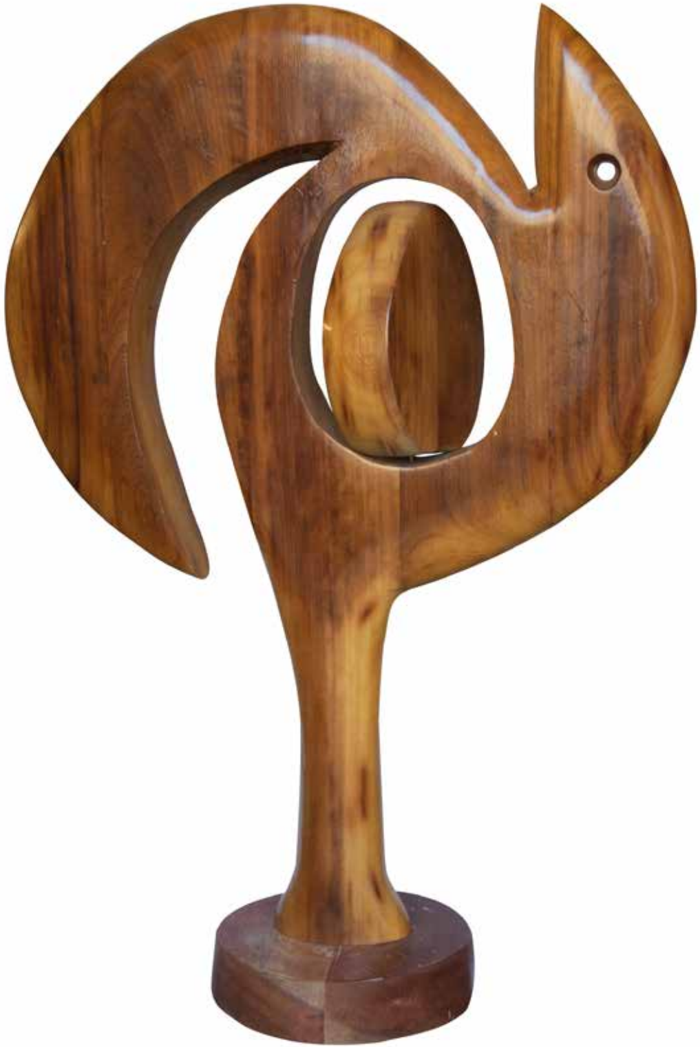
"Soyut Kuş", 140 x 100 x 34 cm, İroko, 2016