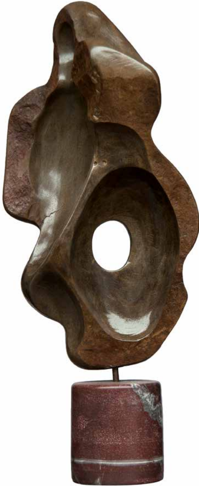
"Ayın Doğuşu", 65 x 20 x 24 cm, Serpantin, 2005