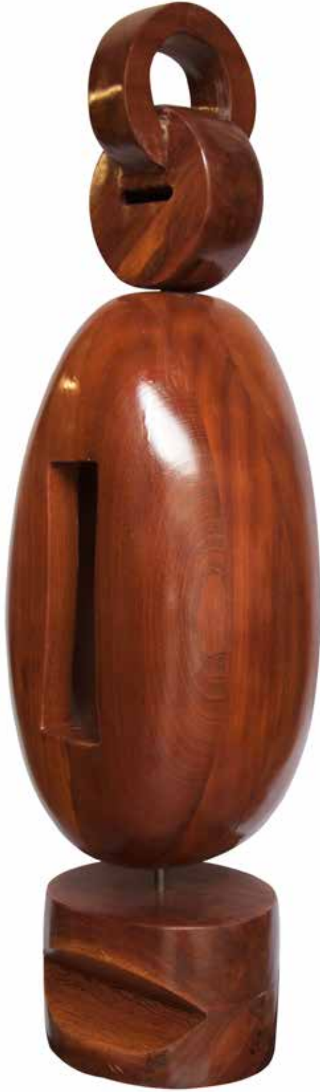
“İç Dünyamızda Yaşamak”, 122 x 34 x 35 cm, Maun, 2014