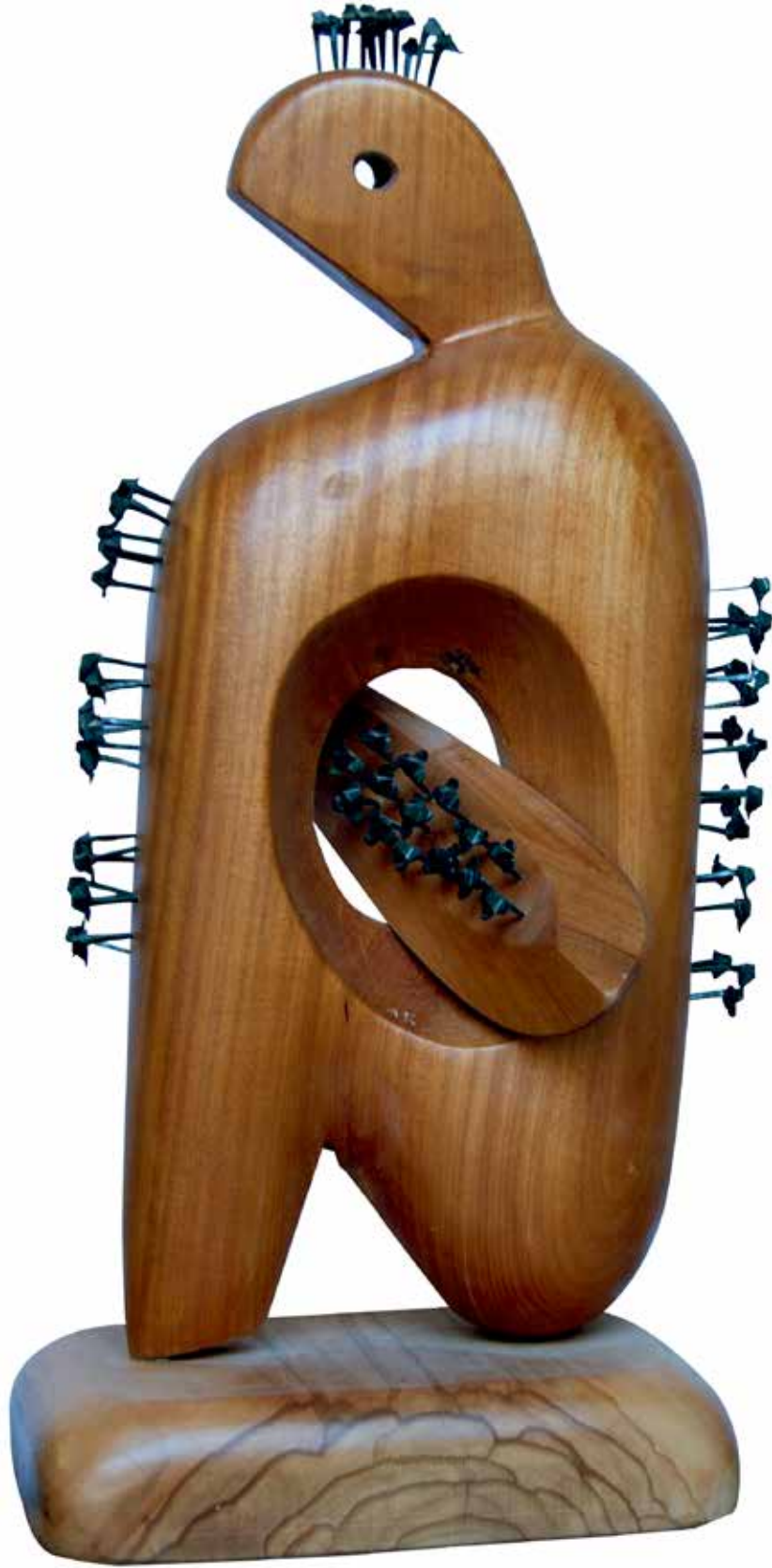
“Çivili Figür”, 84 x 38 x 38 cm, Maun, 2014