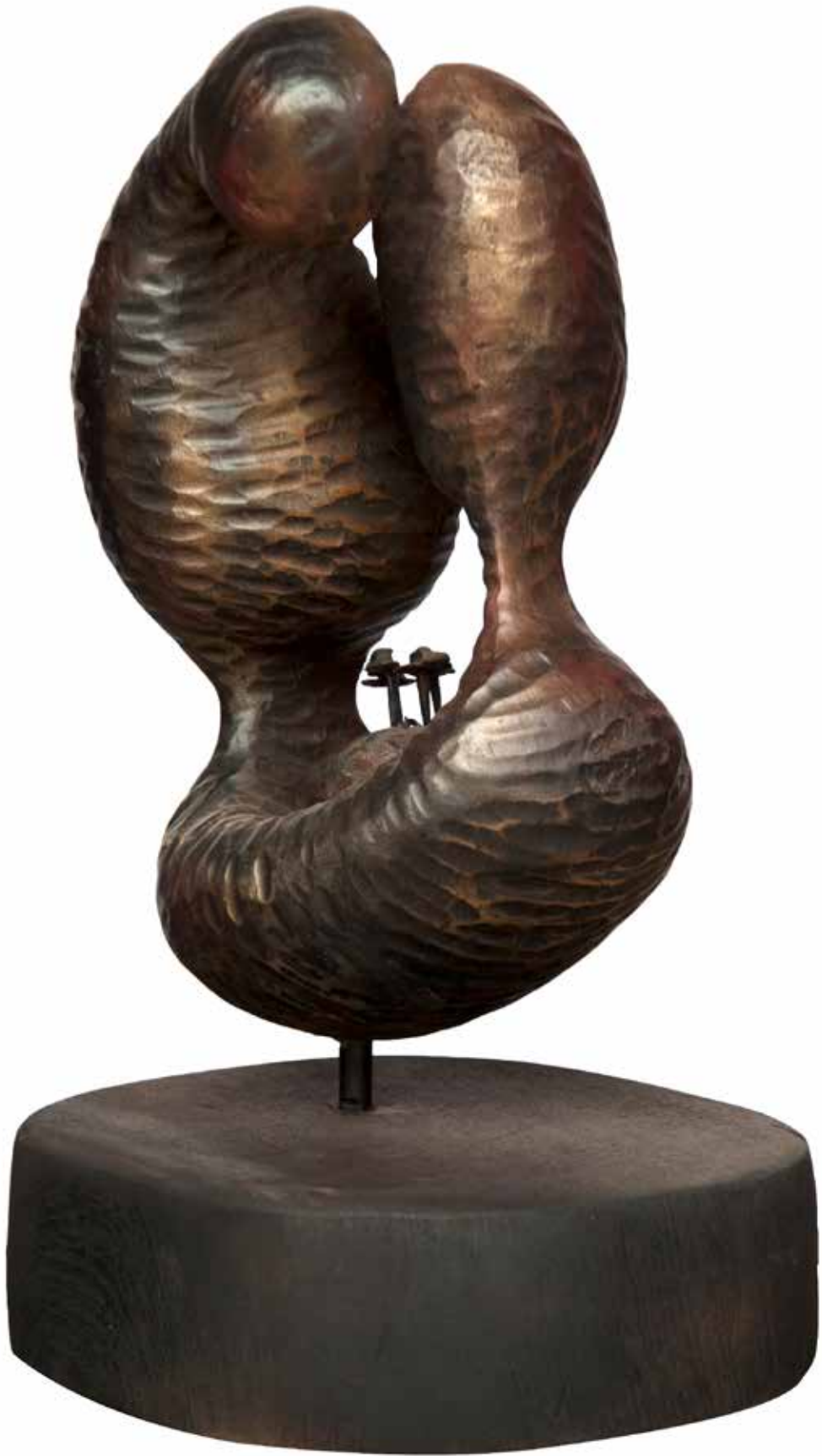
“İç Boşlukta Yaşam”, 55 x 20 x 25 cm, Çeviz, 1987