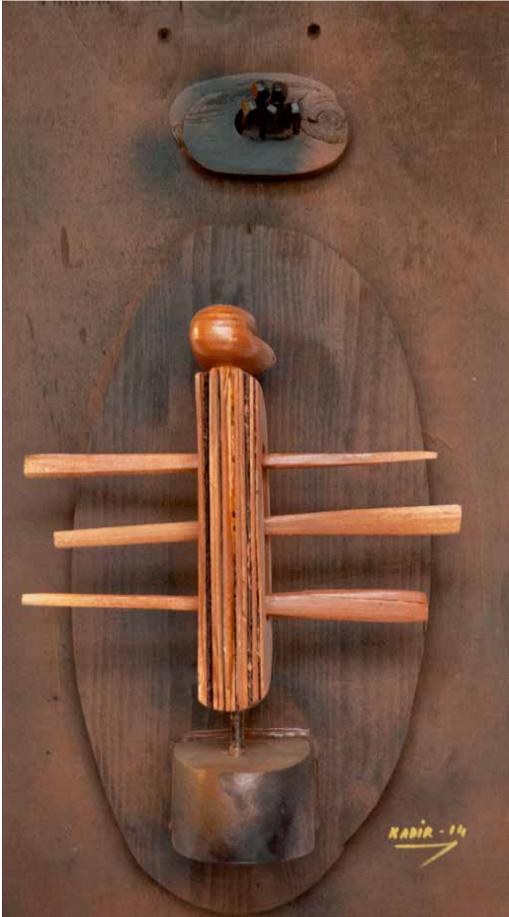
“Kanatlı İdol”, 54 x 31 x 14 cm, Ahşap Pano, 2014