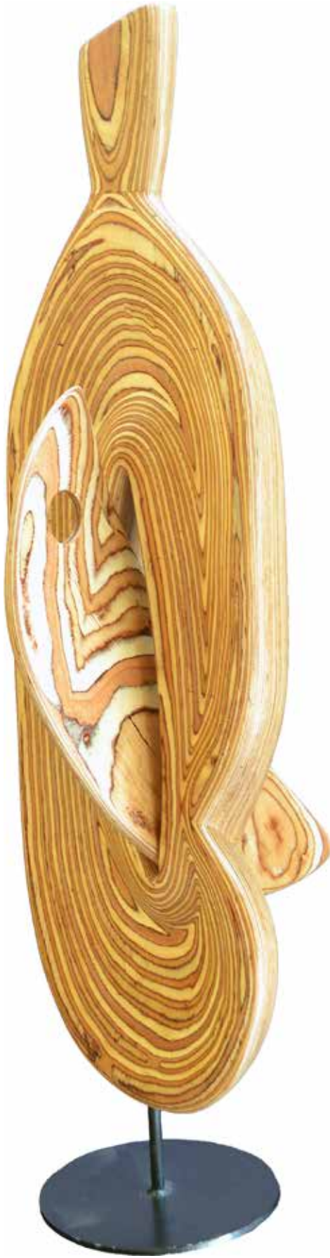
“İçten Geçen Figür”, 170 x 60 x 32 cm, Ahşap, 2013