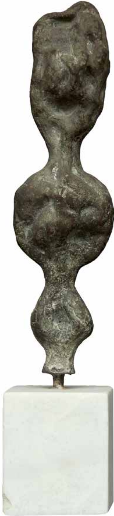
“Boşluktaki Formlaşma”, 44 x 10 x 14 cm, Bronz, 1994