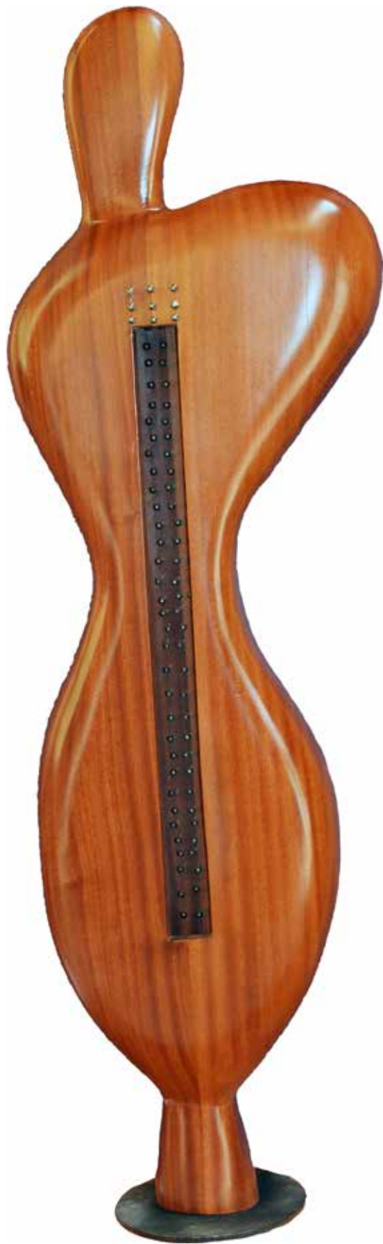
“Soyutlanan Nu”, 180 x 58 x 32 cm, Maun, 2013