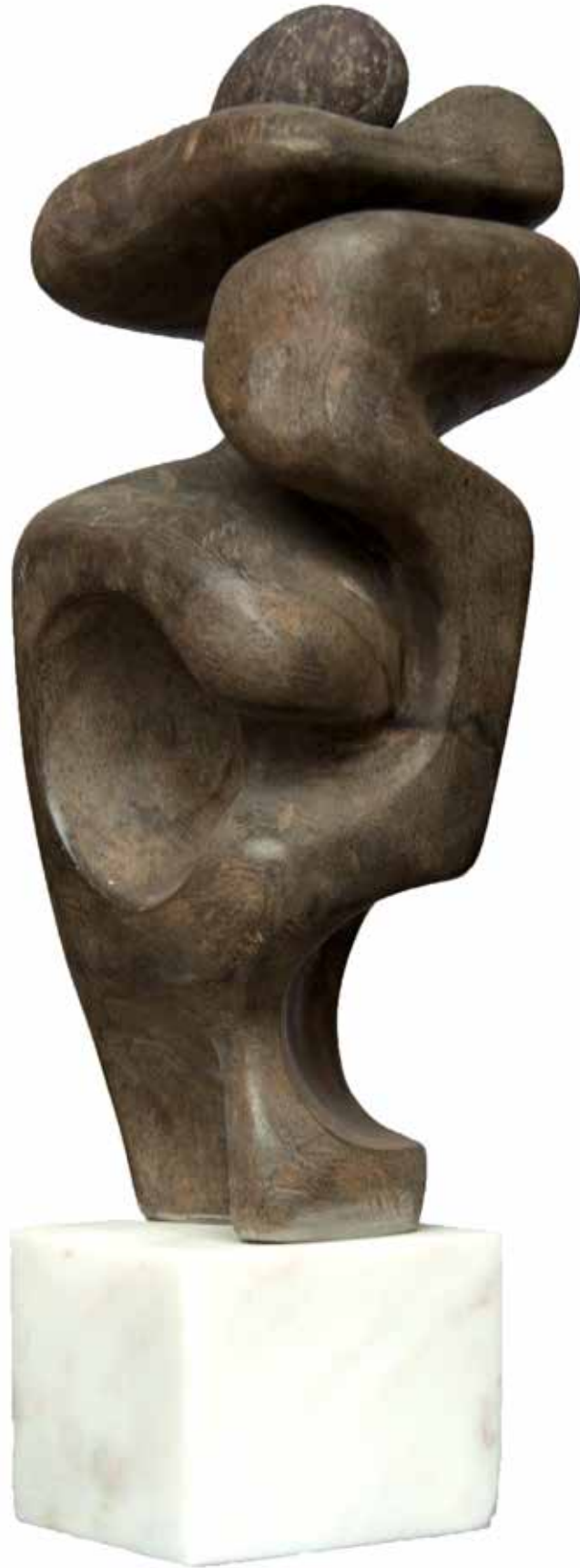
“Taşın Formlaşması”, 52 x 17 x 13 cm, Diorit, 2007