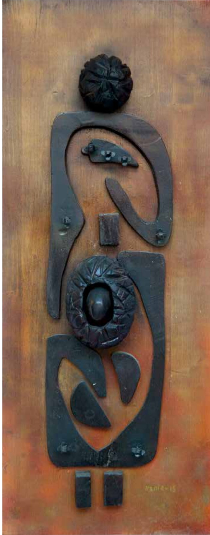
“Panolu İdol”, 100 x 40 x 11 cm, Ahşap Pano, 2015