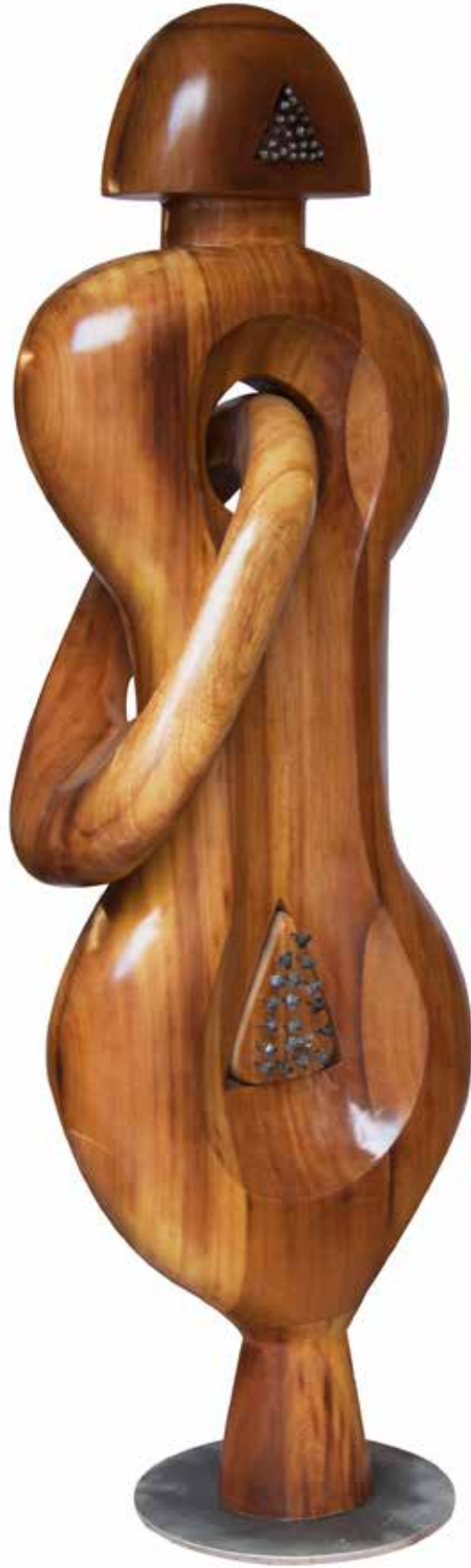
"Büyük İdol", 191 x 64 x 43 cm, İroko, 2016