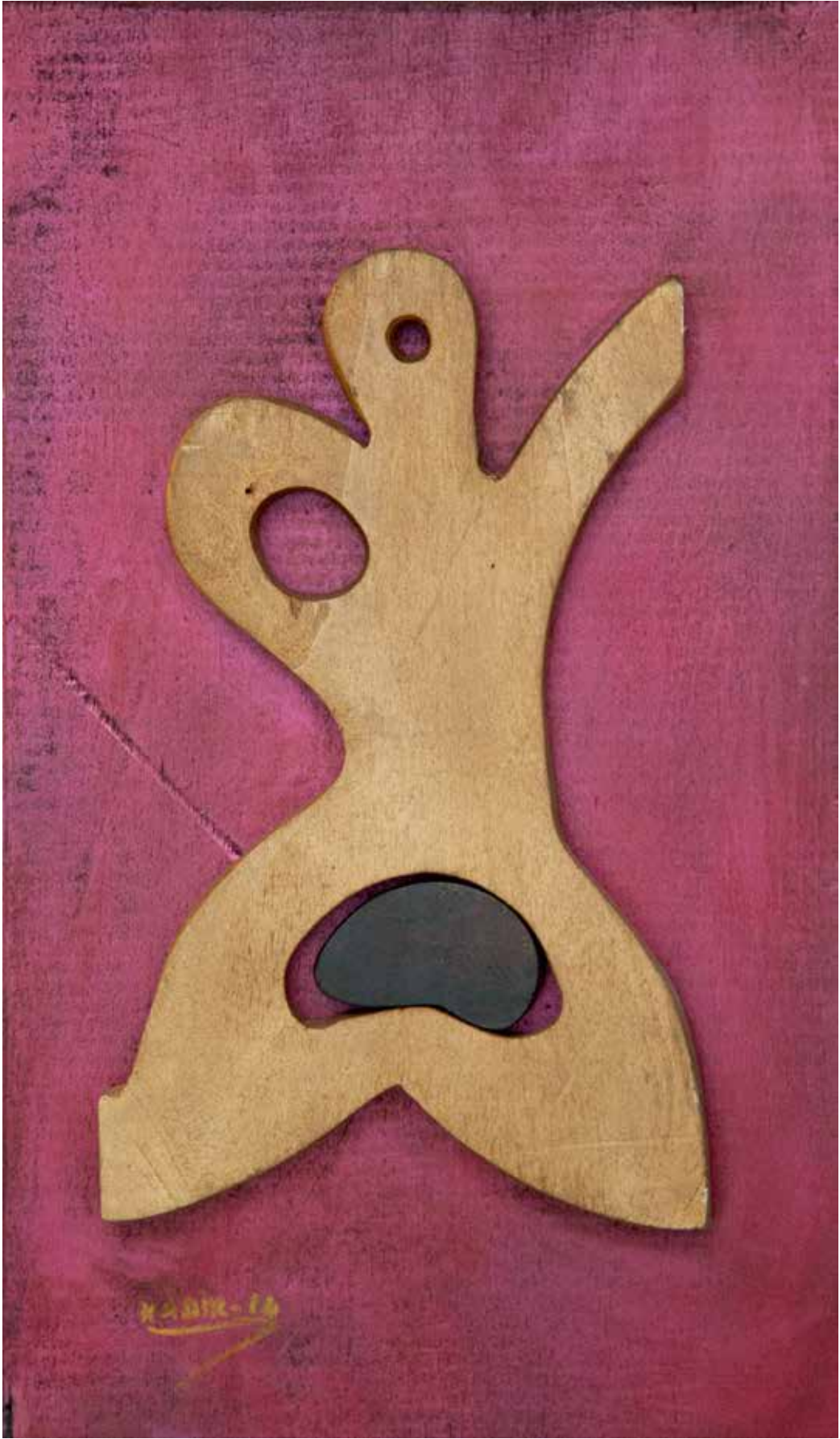
“Figürdeki Denge”, 54 x 31 x 14 cm, Ahşap Pano, 2014