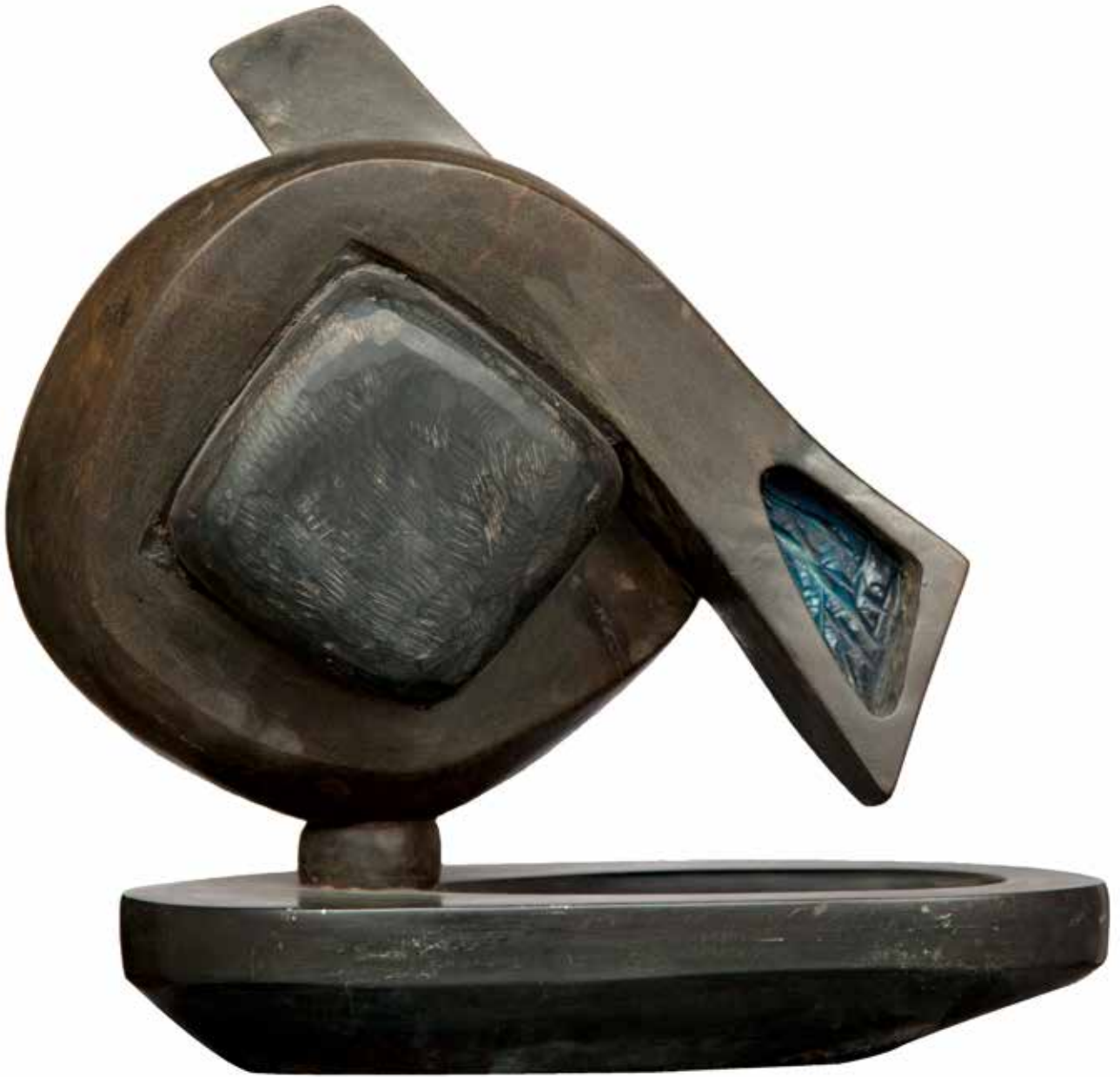
“İçe Sarılmak”, 45 x 35 x 24 cm, Serpantin-Mine, 2004