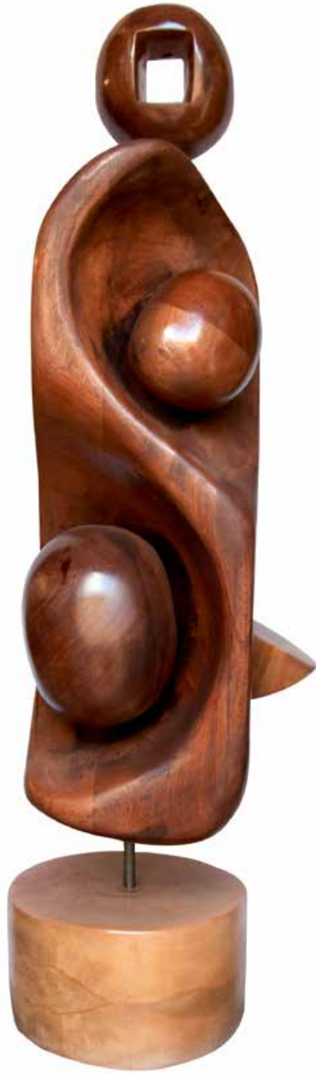
“İdolle Yaşamak”, 132 x 38 x 37 cm, Maun, 2016