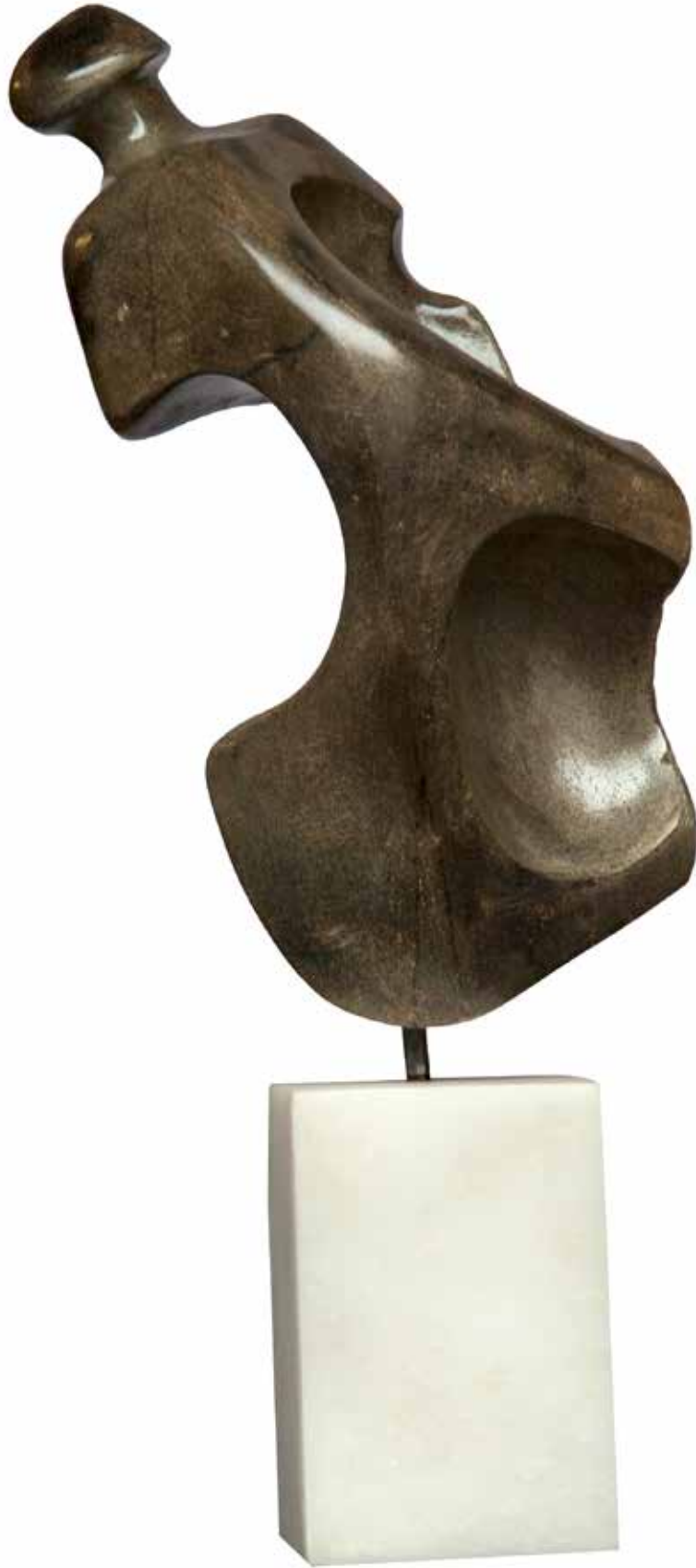
“Boşlukda Duran İdol”, 58 x 22 x 19 cm, Serpantin, 2005