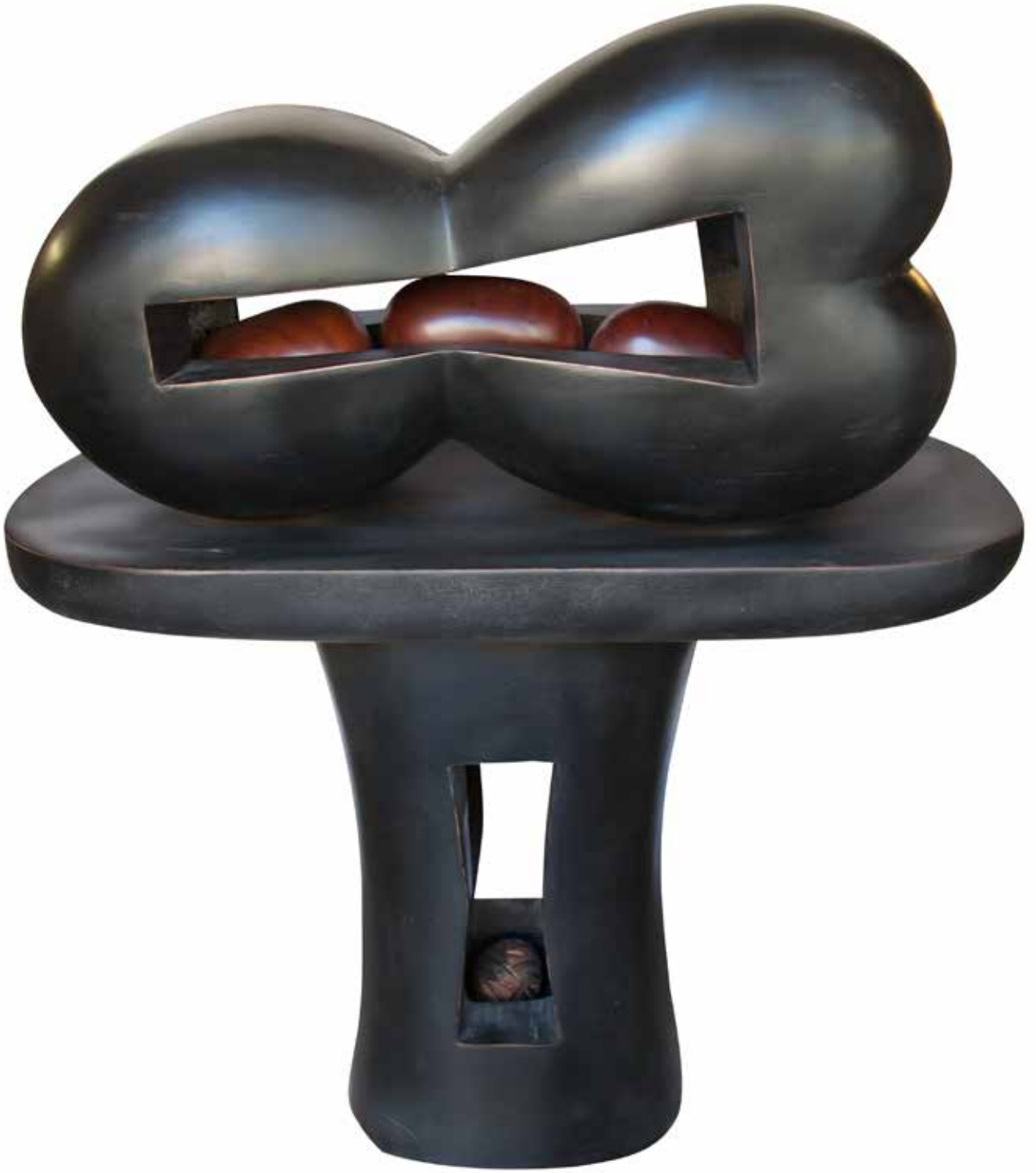
"Masal İinde Olmak", 130 x 107 x 53 cm, Maun, 2014