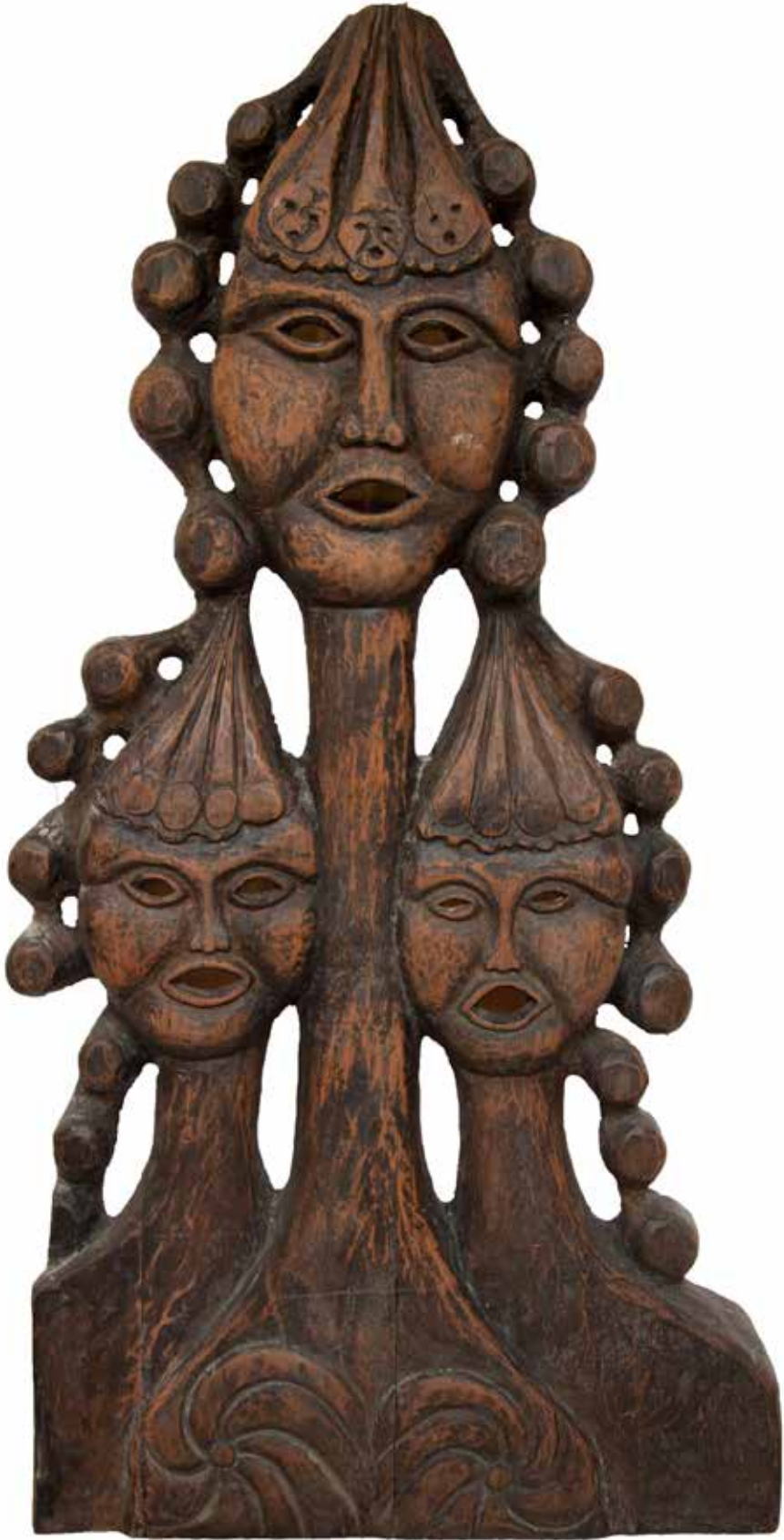
“Üç Başlı Portre”, 90 x 40 x 4 cm, Çeviz, 1989