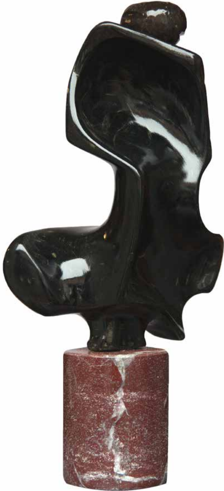
“Taş Üzerinde Durmak”, 55 x 31 x 21 cm, Serpantin, 1996