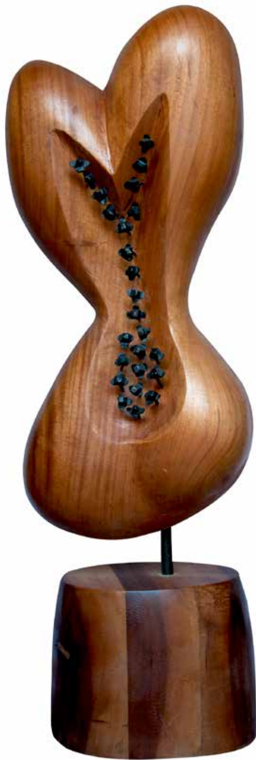
“Sevgi İdolü”, 98 x 34 x 19 cm, Maun, 2015