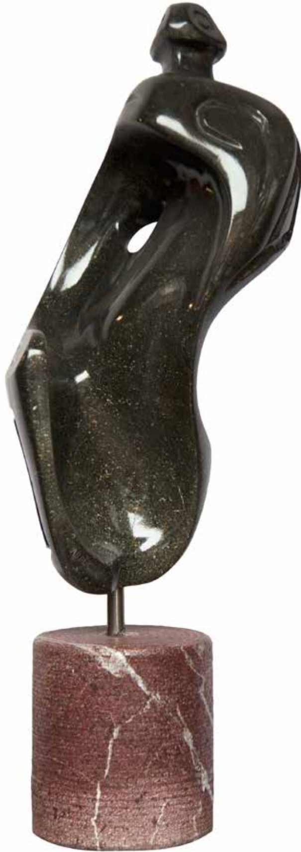
“Taşın Öyküsü”, 55 x 18 x 21 cm, Serpantin, 1996