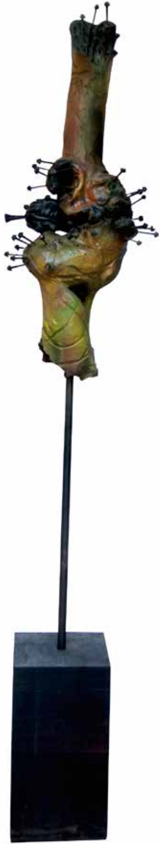
“Boşluktaki Değişim”, 158 x 31 x 26 cm, Çınar, 2013