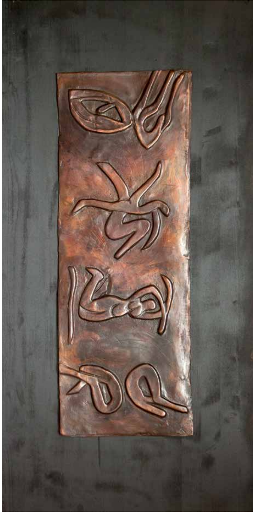
“Rölyefler III”, 120 x 60 x 4 cm, Bronz-Ahşap, 2016