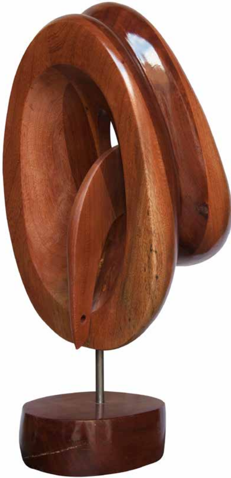
“İç Boşluktan Geçmek”, 81 x 38 x 36 cm, Maun, 2015