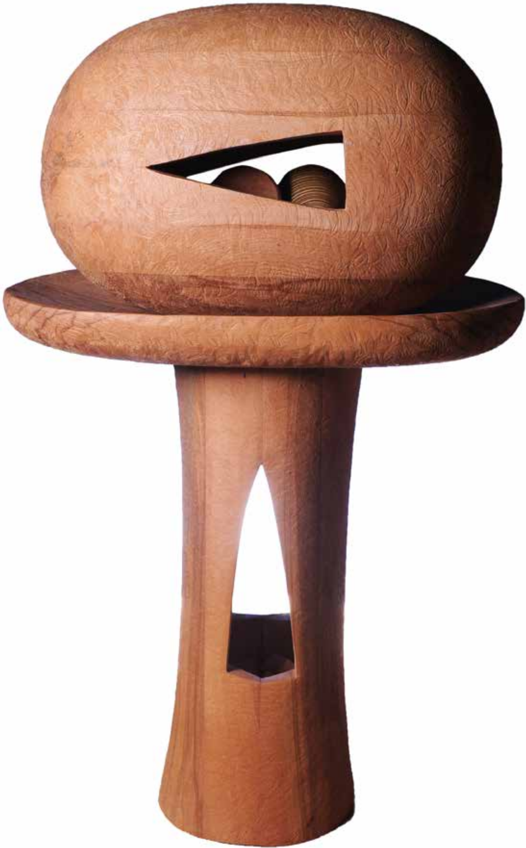
“Masalın Oluşumu”, 133 x 82 x 58 cm, Gürgen, 2014