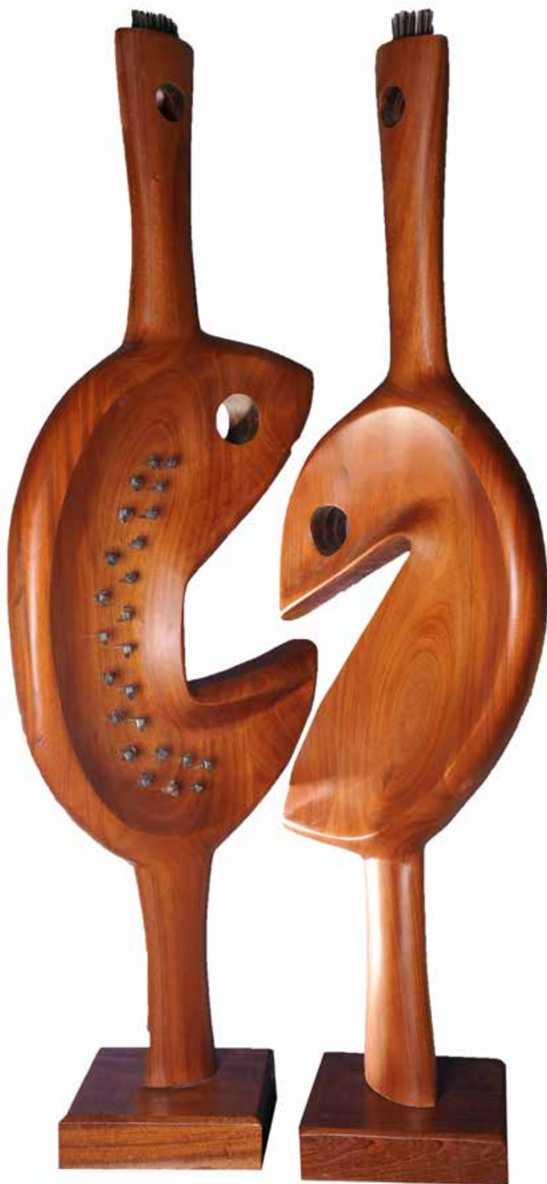
"İkili İdol", 165 x 56 x 10 cm, Maun, 2014