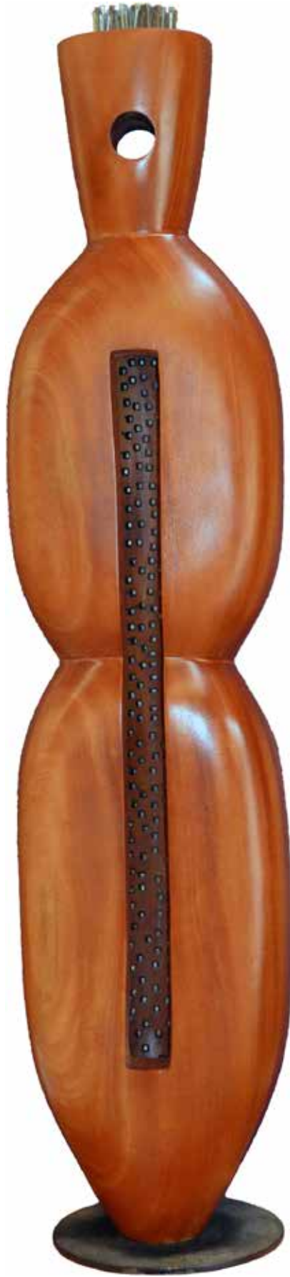
“İç Dünyamız”, 185 x 40 x 40 cm, Maun, 2013