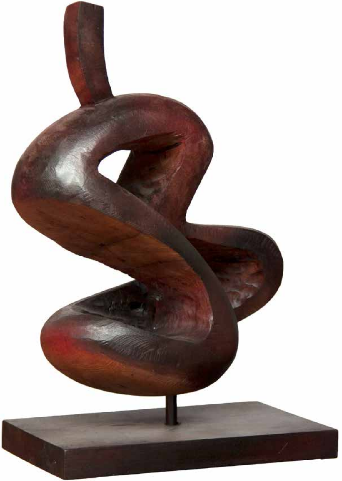
“İç Değişimler”, 59 x 30 x 18 cm, Çeviz, 2002