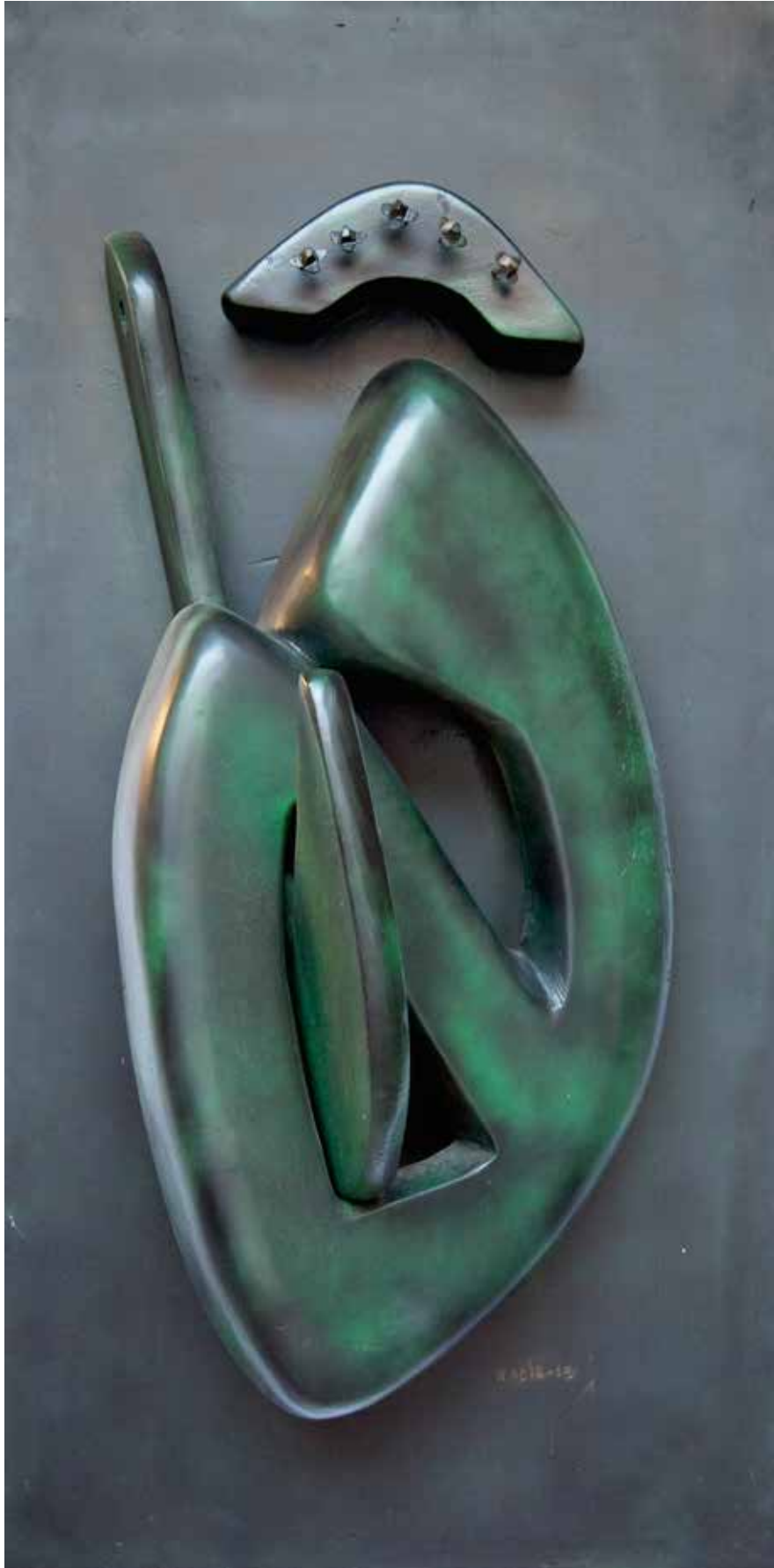
“İçten Tutunmak”, 120 x 60 x 42 cm, Ahşap Pano, 2014