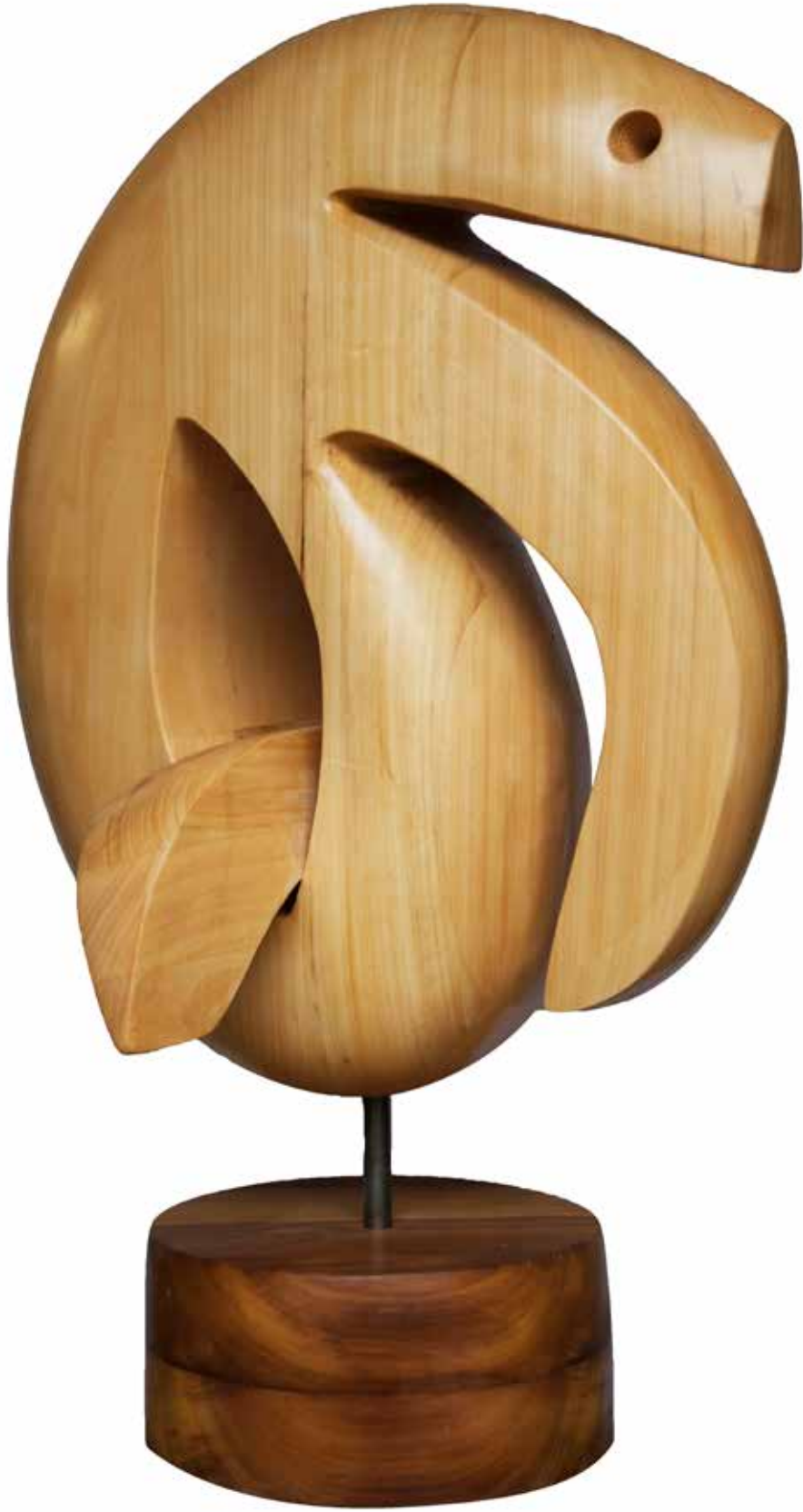
"İç Dünyamız", 134 x 85 x 77 cm, Ayos, 2016