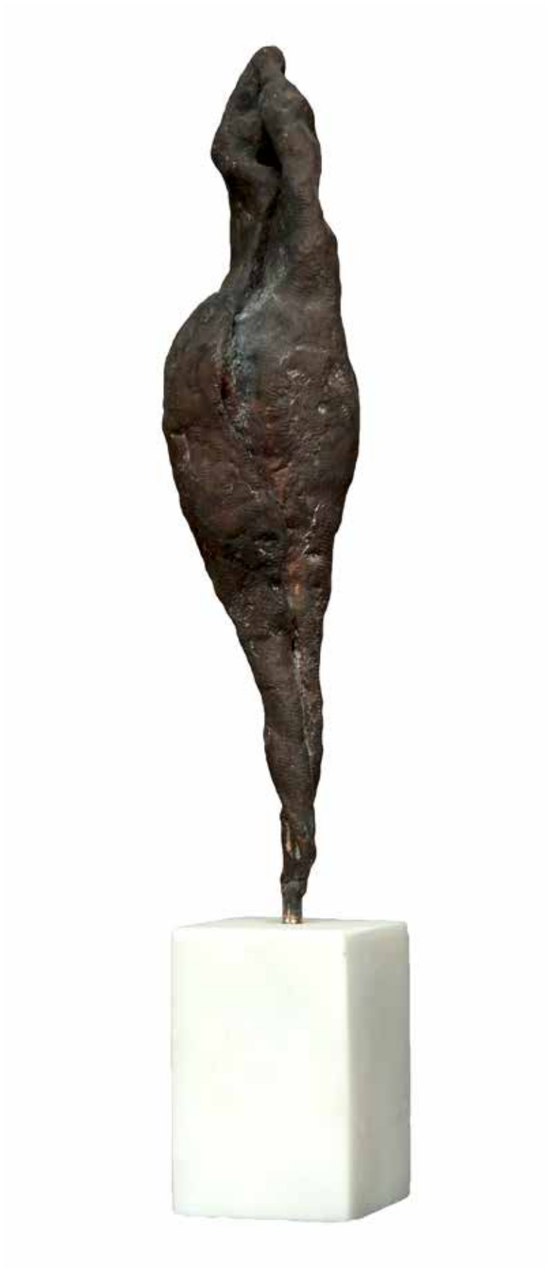
“Boşluğa Uzanmak”, 45 x 12 x 12 cm, Bronz, 1994