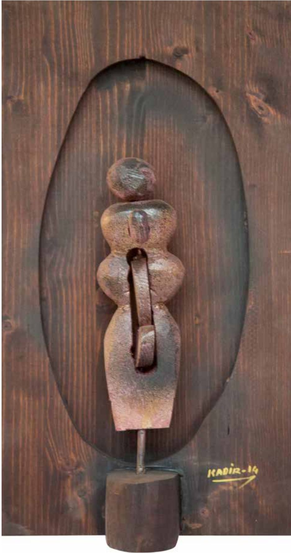
"İdolun Duruşu", 54 x 31 x 14 cm, Ahşap Pano, 2014