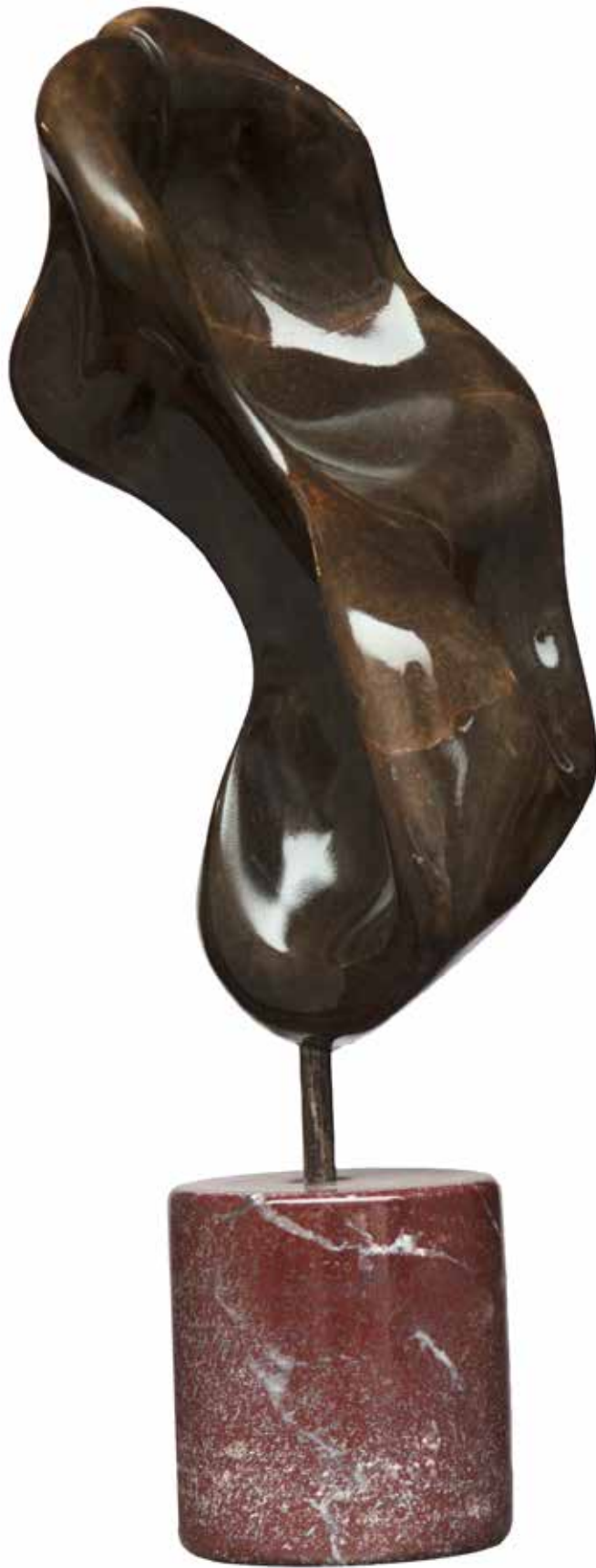
“Soyutlaşma”, 56 x 21 x 17 cm, Serpantin, 2004