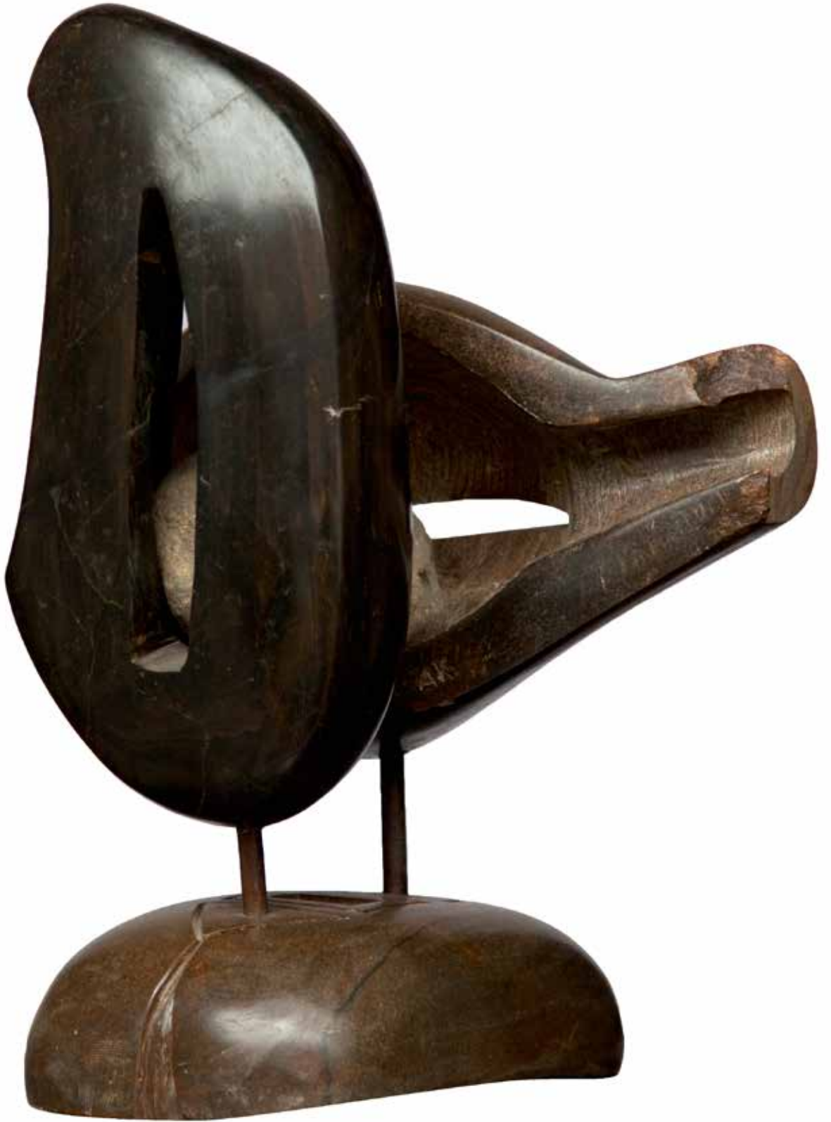
“İçteki Olgular”, 37 x 27 x 21 cm, Serpantin, 2004