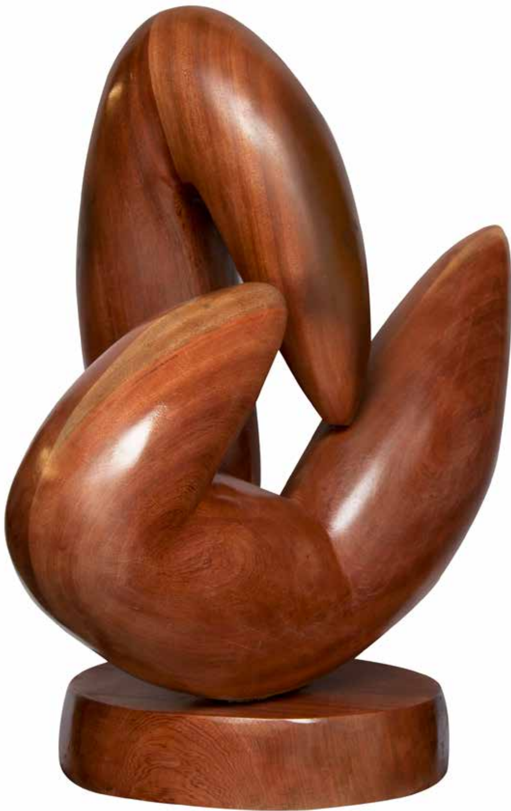
"Ikili Form", 84 x 77 x 43 cm, Maun, 2015