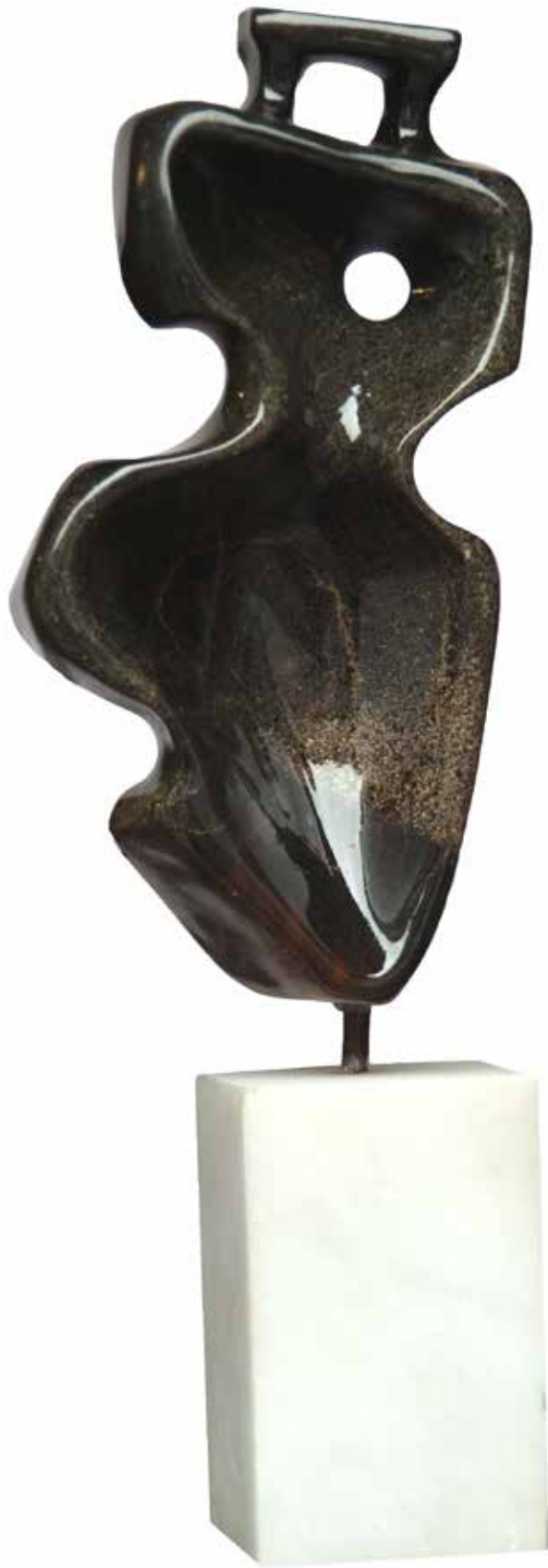
“Pencereli İdol”, 46 x 14 x 14 cm, Serpantin, 2007