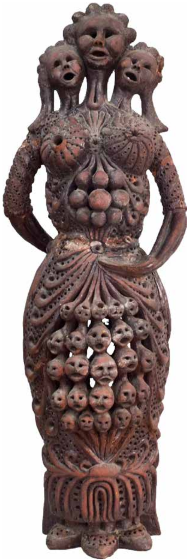
"Anadolu", 79 x 25 x 20 cm, Terekota, 1983