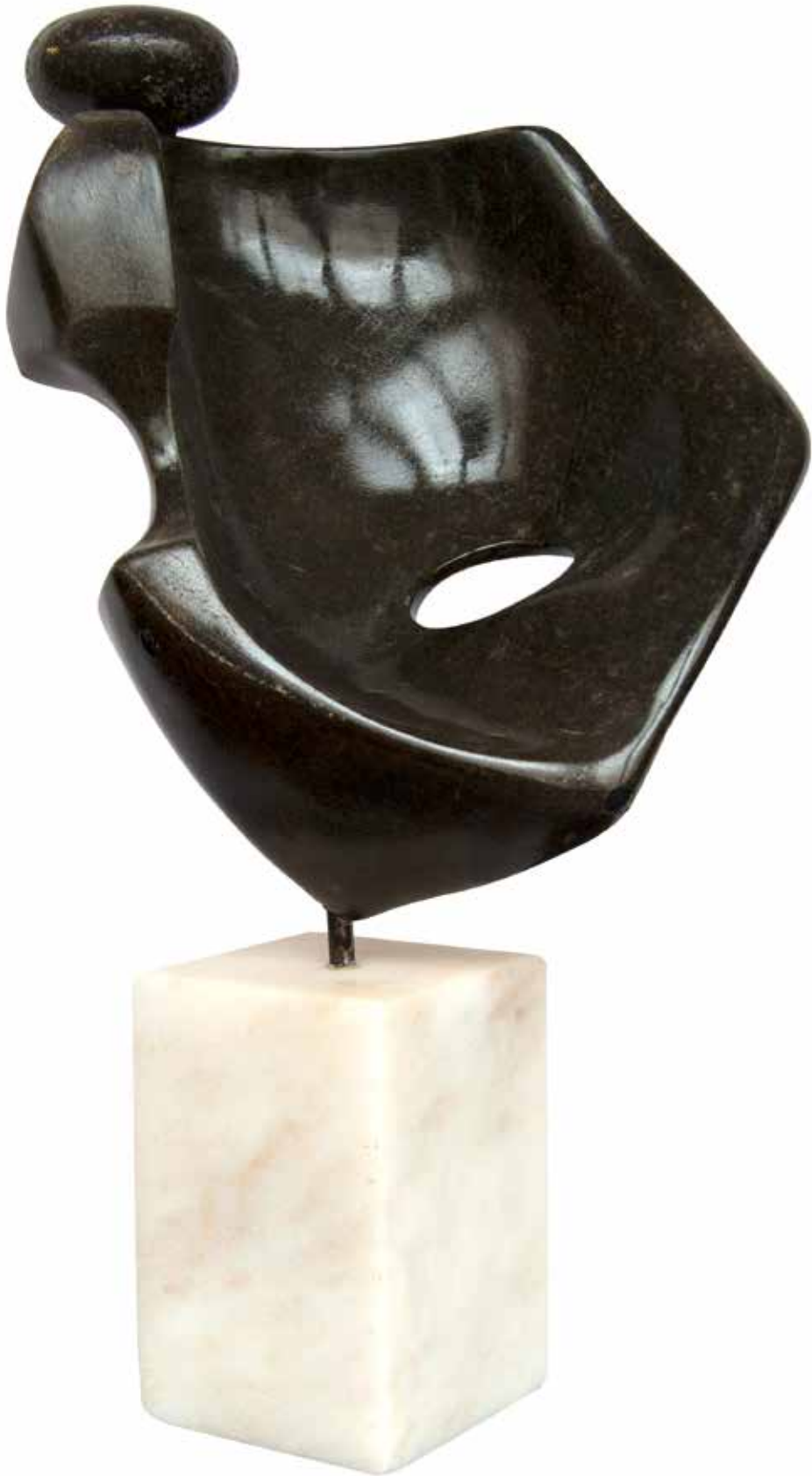
"Dolunayı Tutmak", 42 x 26 x 16 cm, Serpantin, 2007