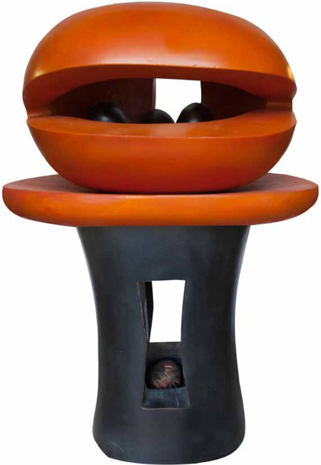
"Kömür Alevinden Doğmak", 132 x 87 x 60 cm, Gürgen, 2016