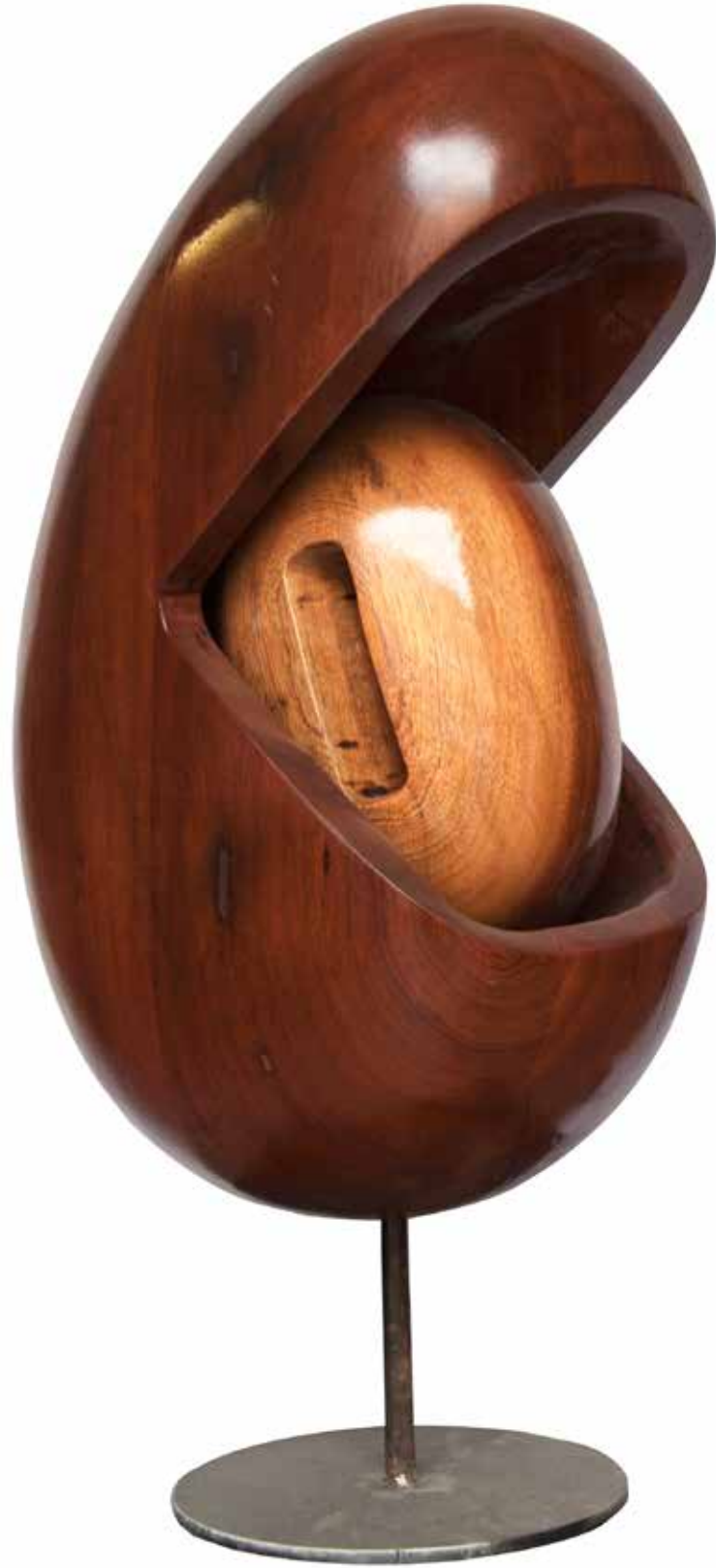
“İçteki Oluşum”, 81 x 40 x 28 cm, Maun, 2015