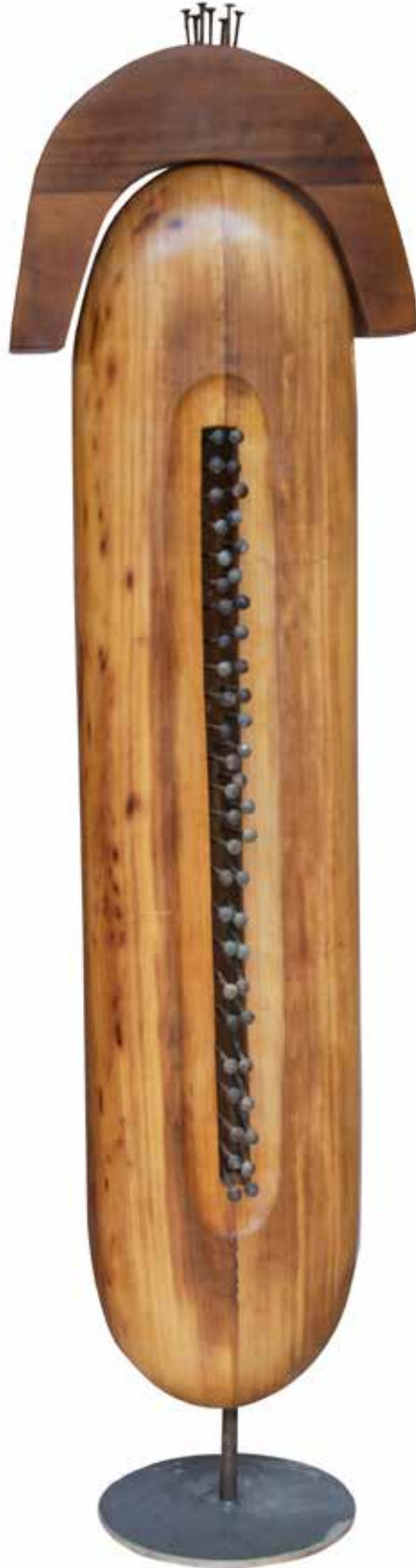
“Çivili Büyük İdol”, 210 x 57 x 34 cm, İroko, 2016