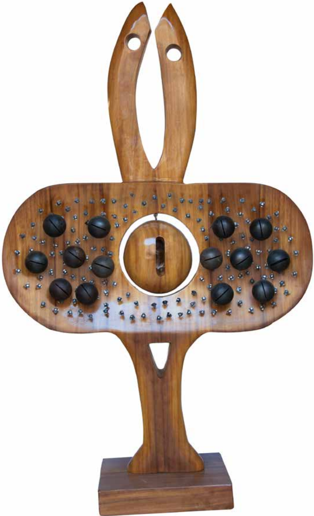
"Masalın İçindekiler", 199 x 121 x 40 cm, İroko, 2016