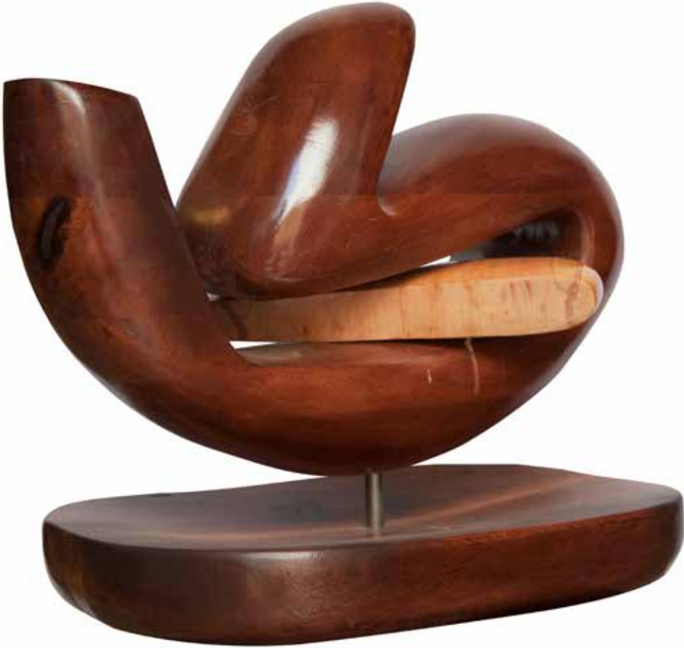
“Sevgiyi Taşımak”, 54 x 68 x 38 cm, Maun, 2015