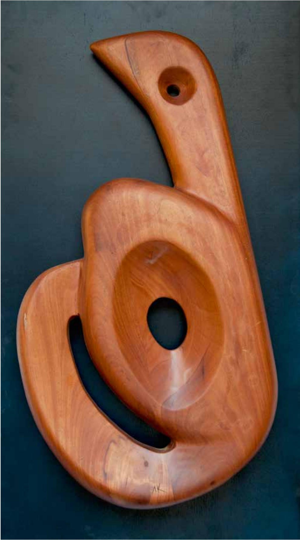
"Mitolojik Bakış", 107 x 60 x 14 cm, Ahşap Pano, 2015