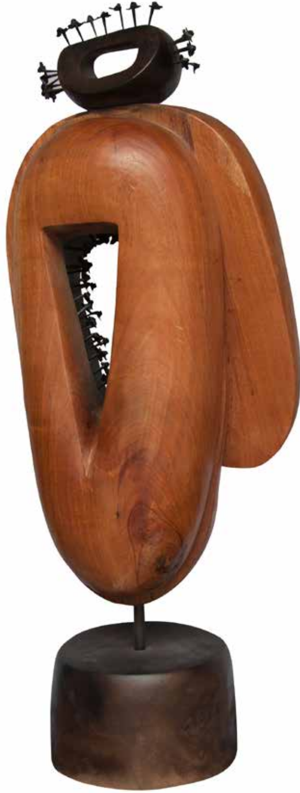
“İçteki Çiviler”, 117 x 43 x 34 cm, Maun, 2014