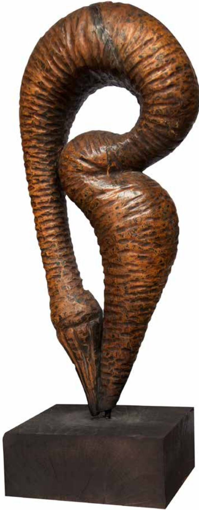
“İçe Dönmek”, 85 x 36 x 26 cm, Çeviz, 1987