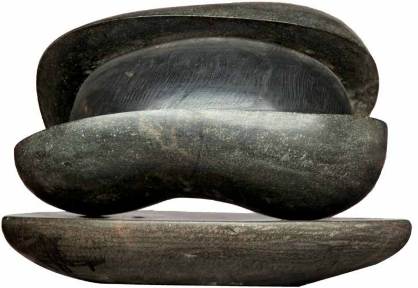
“Kendine Dönmek”, 25 x 36 x 30 cm, Serpantin-Mine, 2004