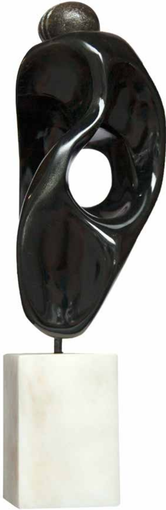
“Ay Boşluğunu Tutmak”, 64 x 37 x 35 cm, Serpantin, 2005