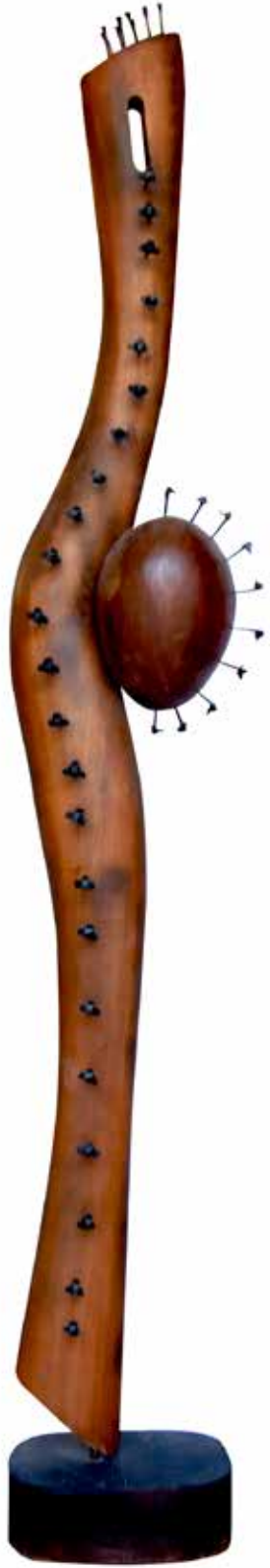
"İdolün Yaşamı", 188 x 35 x 20 cm, Maun, 2013