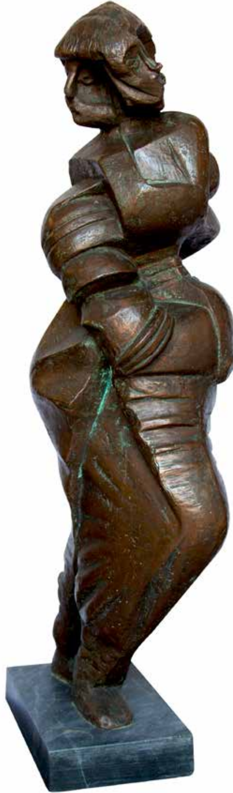
“Üç Başlı Figür”, 105 x 33 x 32 cm, Bronz, 1994