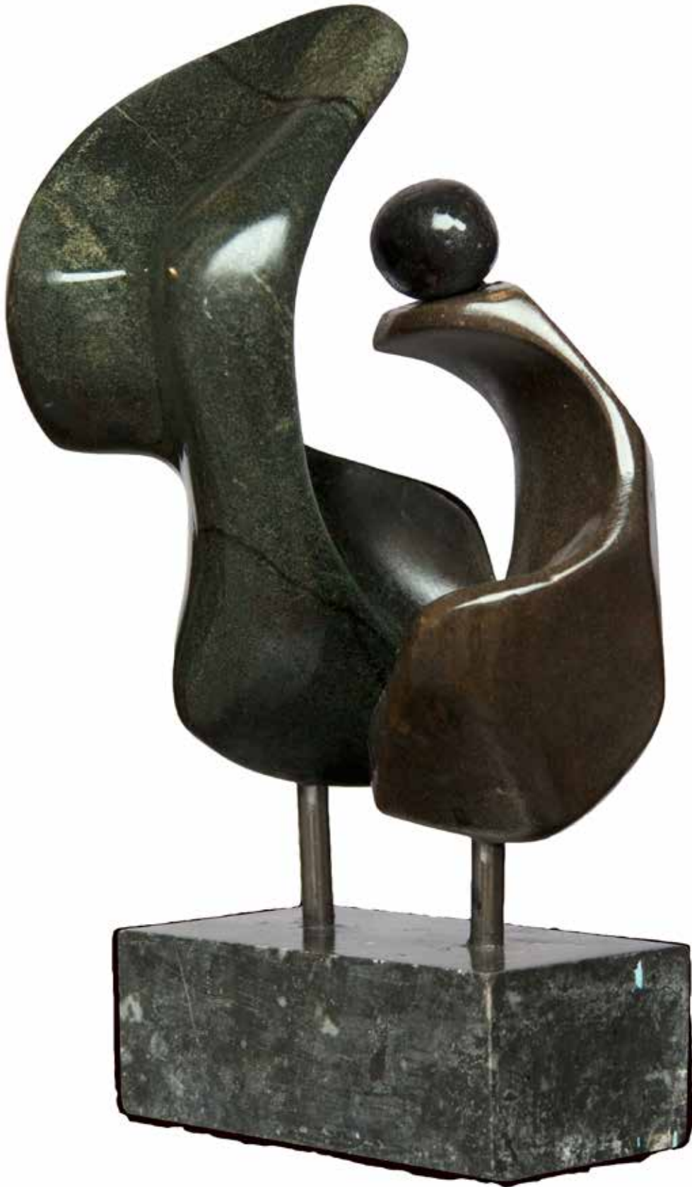
"İkili Yaşam", 42 x 24 x 17 cm, Serpantin, 2007