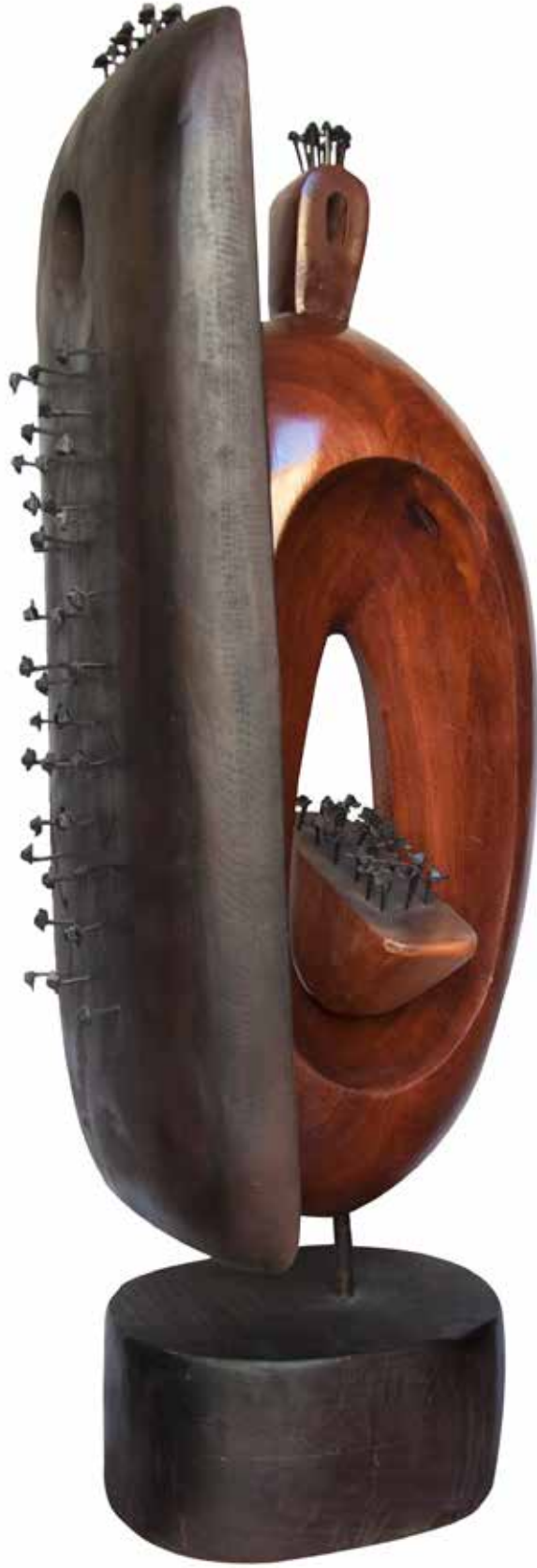
“İç ve Dıştaki Oluşumlar”, 130 x 40 x 52 cm, Maun, 2015