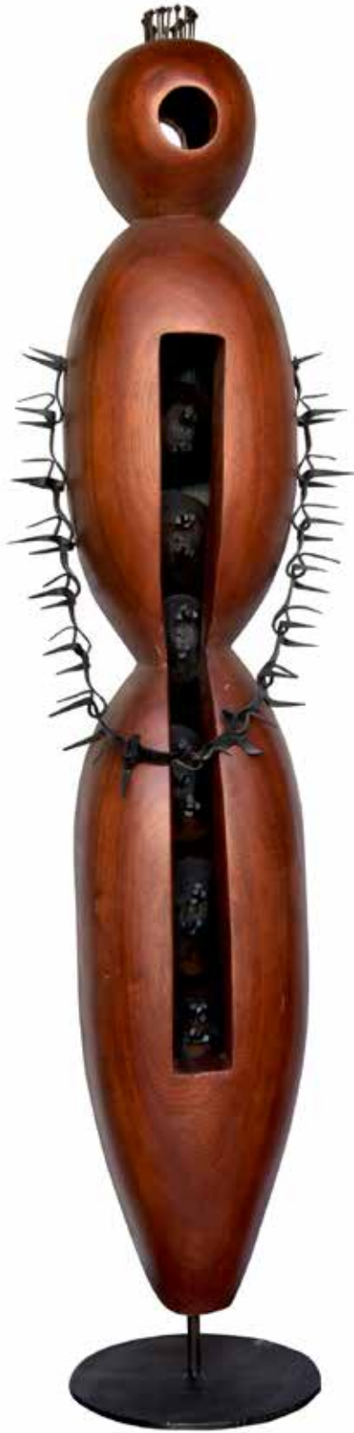
“Tasmalı İdol”, 166 x 35 x 36 cm, Maun, 2014