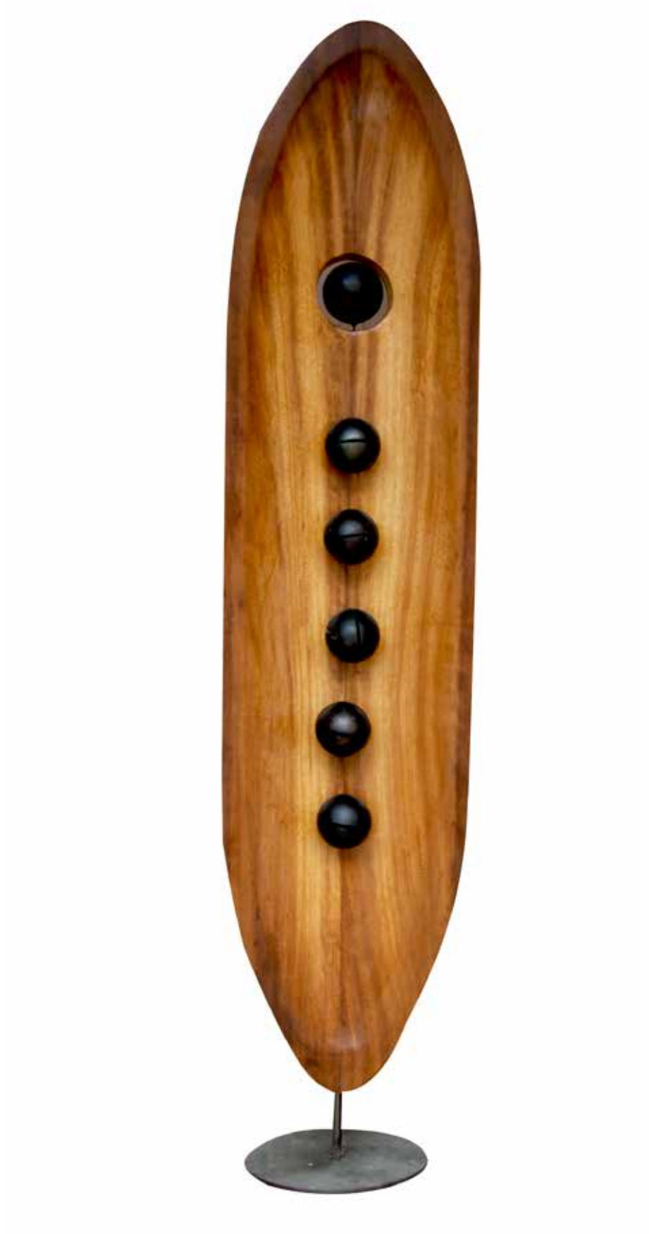
“Sozsuzluk”, 187 x 41 x 26 cm, İroko, 2015