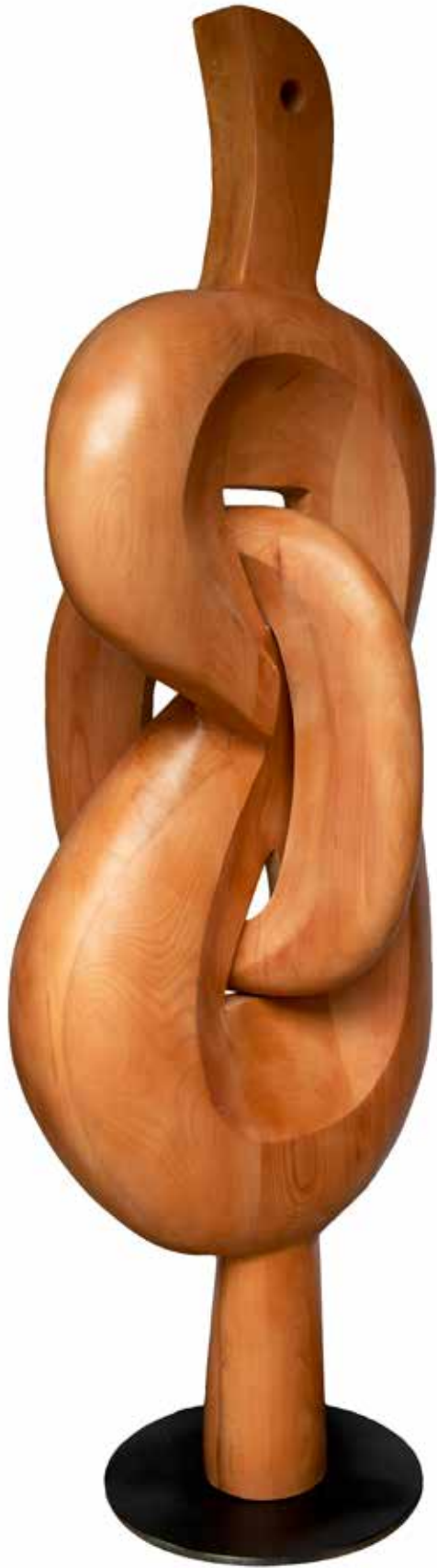
"İçten Tutunmak", 187 x 87 x 50 cm, Gürgen, 2016