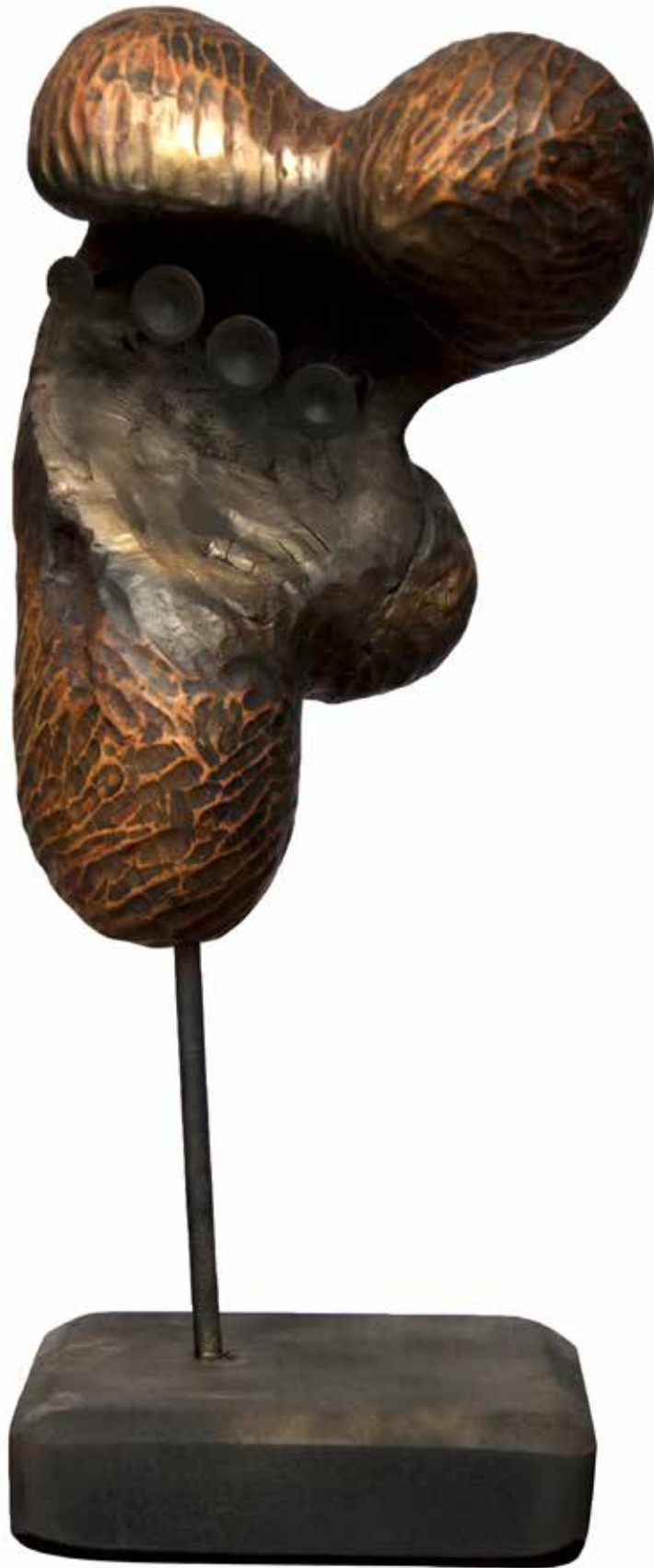
"Dönüşüm", 90 x 37 x 28 cm, Çeviz, 1987