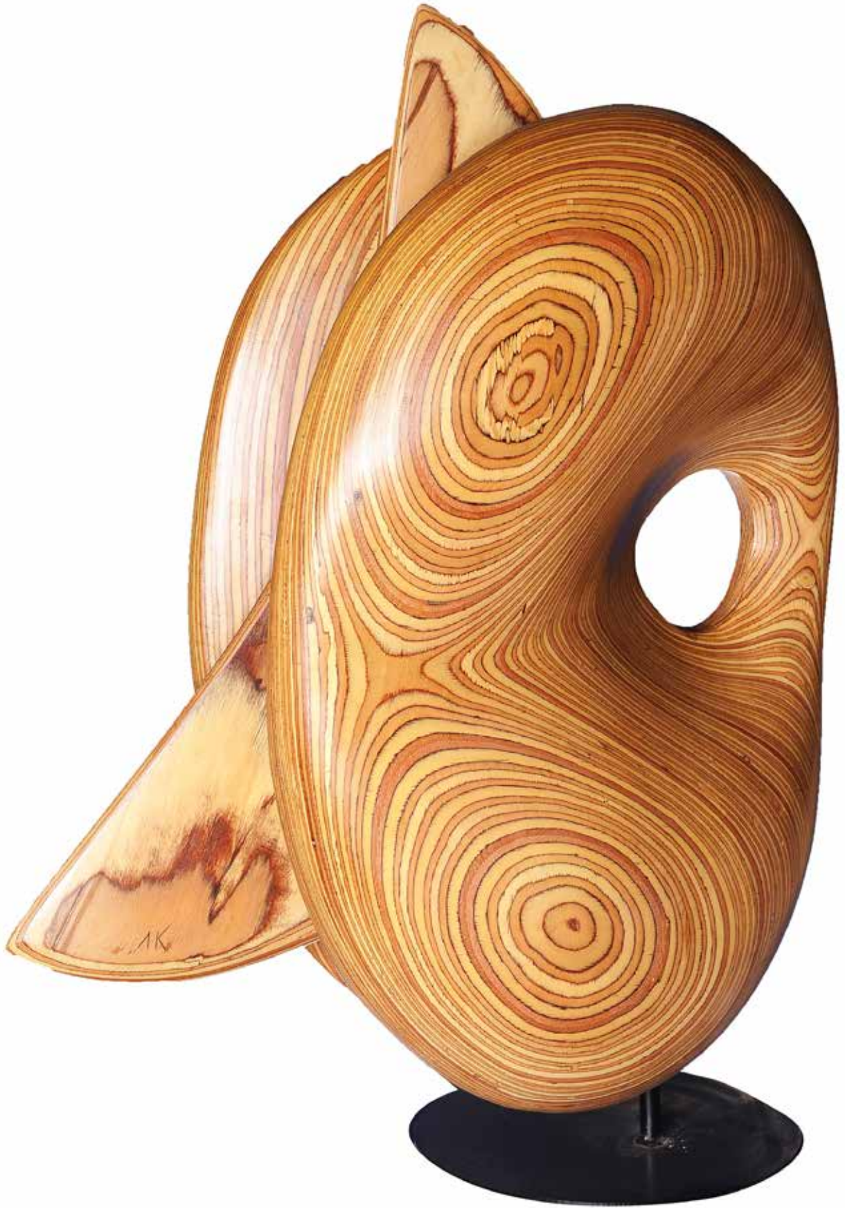
“Formun Oluşumu”, 87 x 54 x 38 cm, Ahşap, 2013