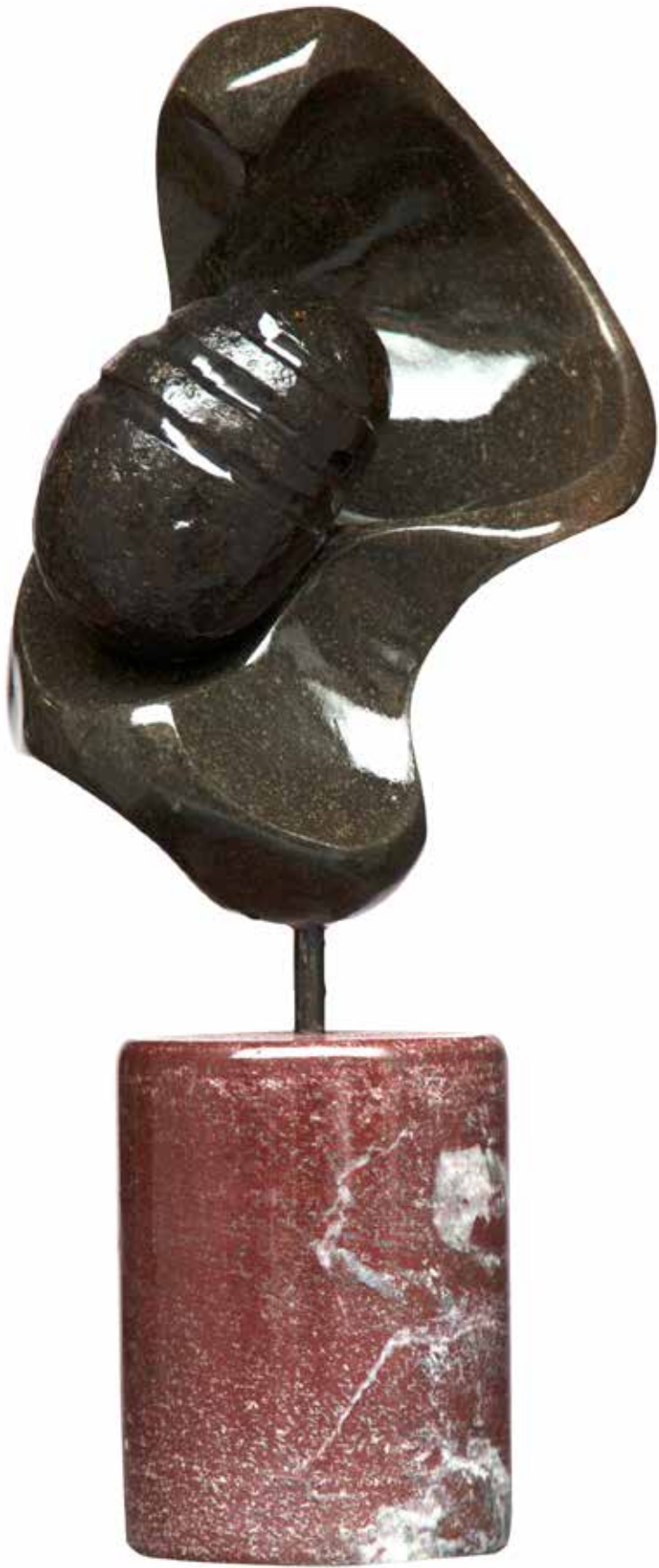
“İç Dünyamızın Değişimi”, 39 x 16 x 14 cm, Serpantin, 2007