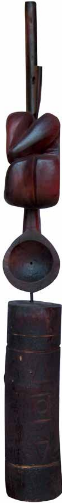
"Bereket İdolü", 155 x 20 x 18 cm, Çınar, 2007