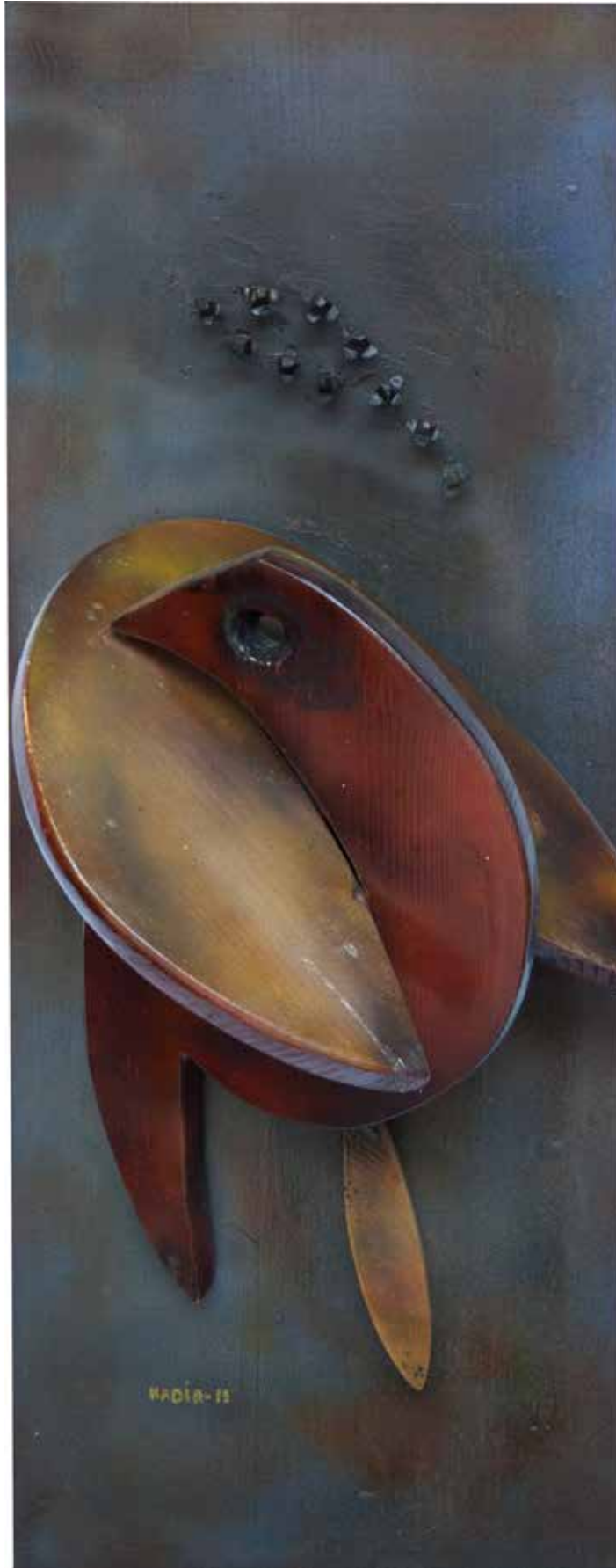
“Birbirine Tutunmak”, 100 x 40 x 26 cm, Ahşap Pano, 2015