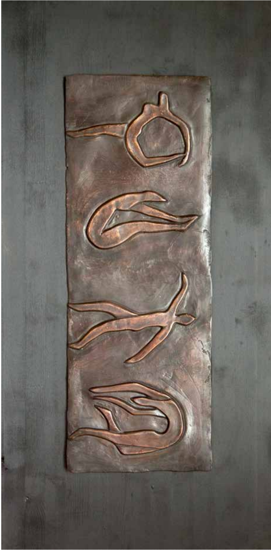
“Rölyefler I”, 120 x 60 x 4 cm, Bronz-Ahşap, 2016