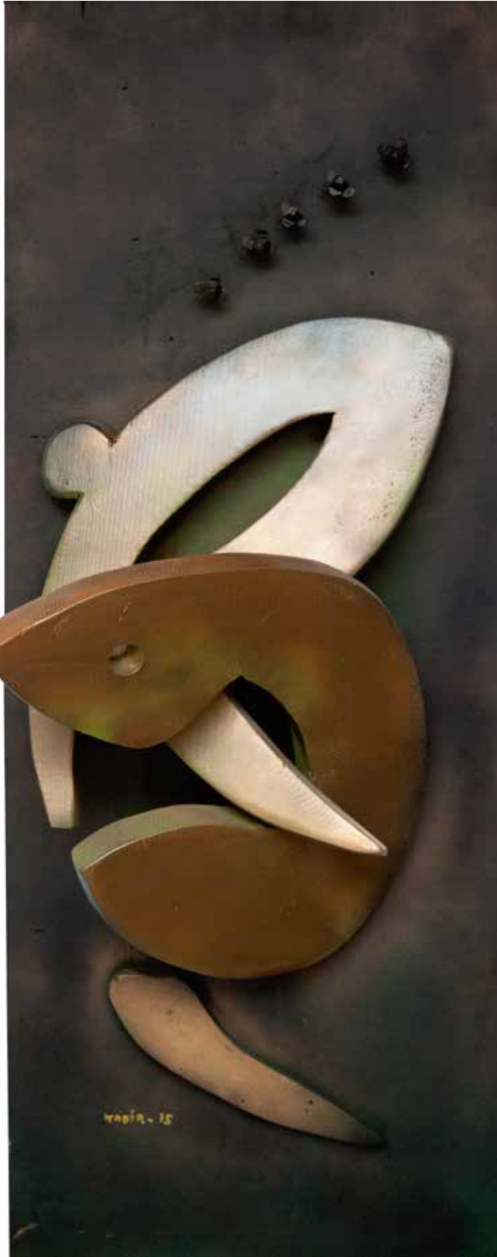
“İçiçe Olan Figürler”, 100 x 40 x 20 cm, Ahşap Pano, 2015