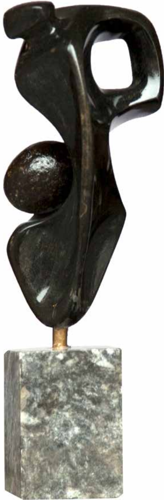
“Farklı Oluşum”, 40 x 14 x 17 cm, Serpantin, 2007