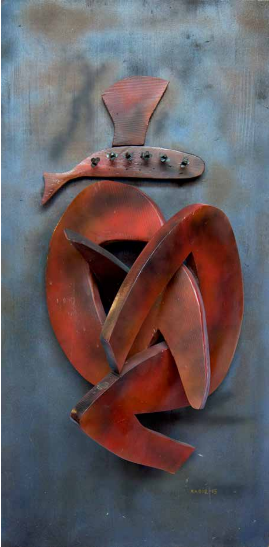
“İçten Sarılmak”, 120 x 60 x 29 cm, Ahşap Pano, 2015