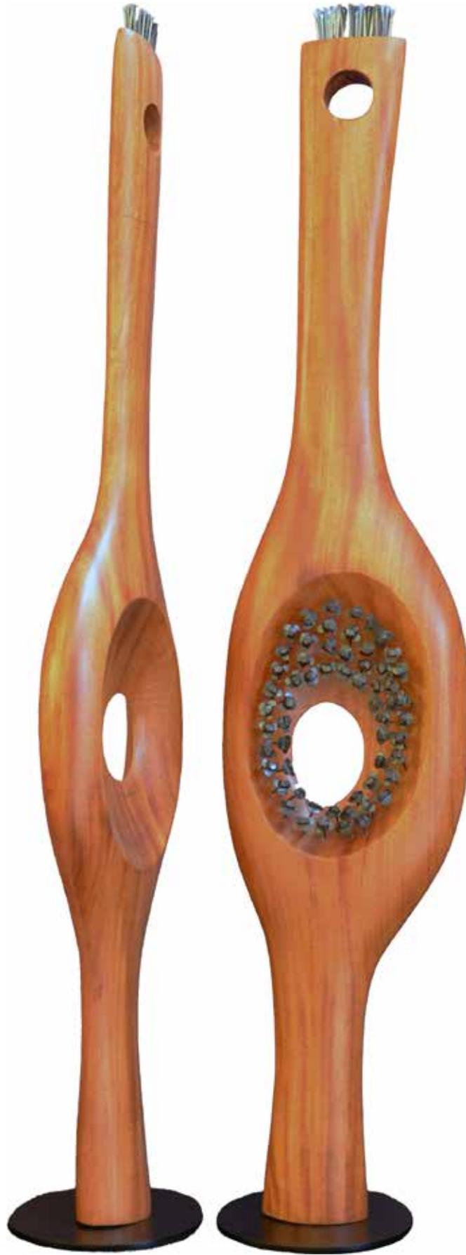
“Sevgi Ocağı”, 154 x 55 x 32 cm, Maun, 2013