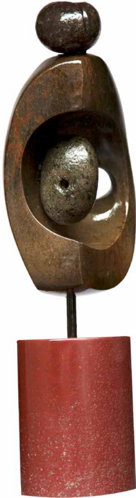
“Ay Işığına Tutunmak”, 42 x 15 x 15 cm, Serpantin, 2000