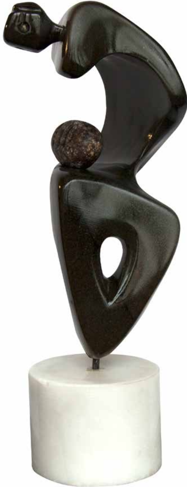
"Kucaktaki Sevgi", 54 x 22 x 21 cm, Serpantin, 1996