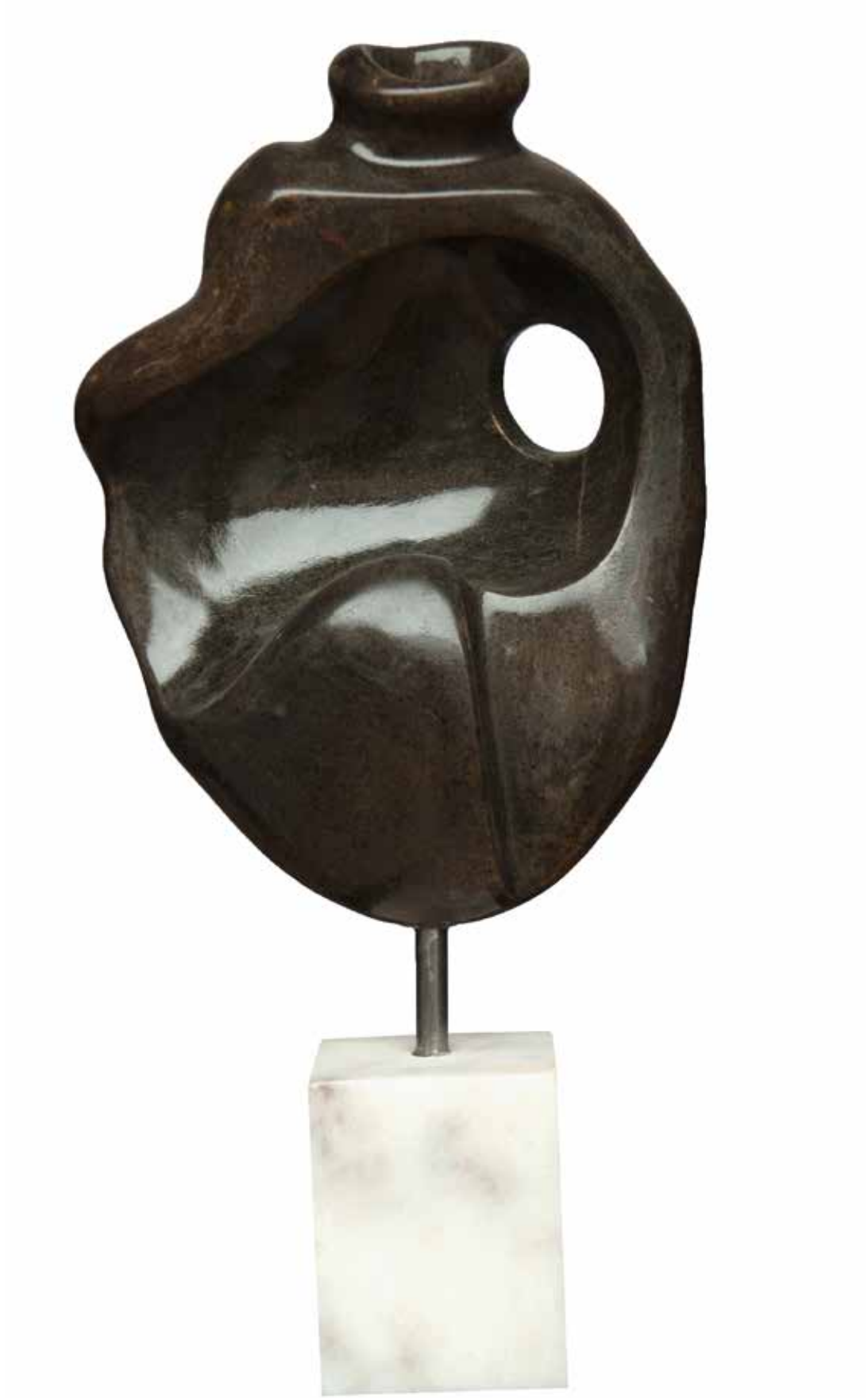
“Ay Işığı”, 67 x 31 x 19 cm, Serpantin, 2005