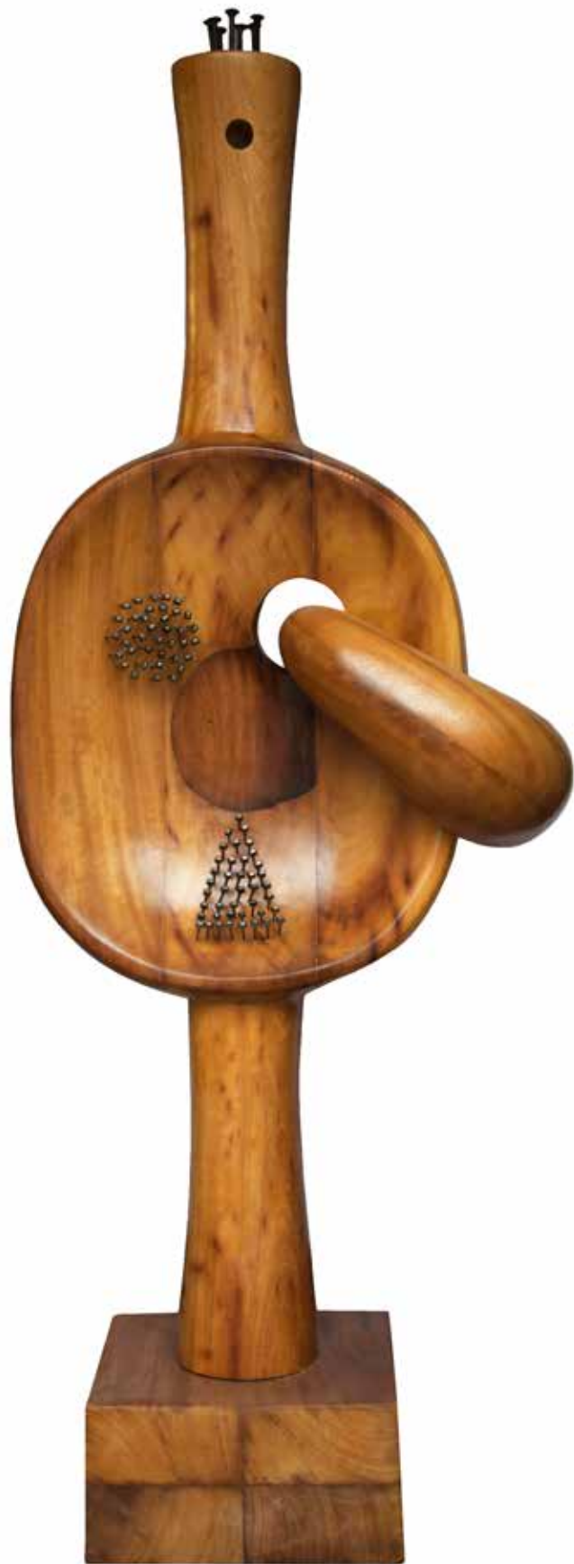
“İdole Tutunmak”, 198 x 69 x 40 cm, İroko, 2016