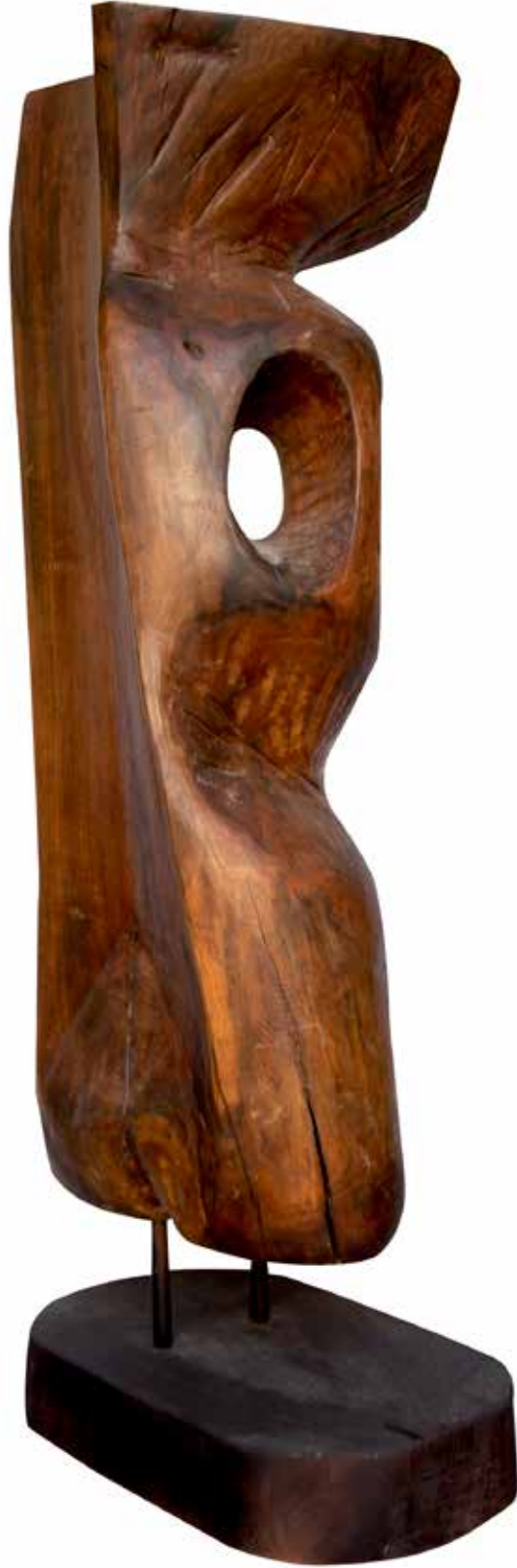
“Doğal Farklılaşma”, 125 x 35 x 38 cm, Çeviz, 1995