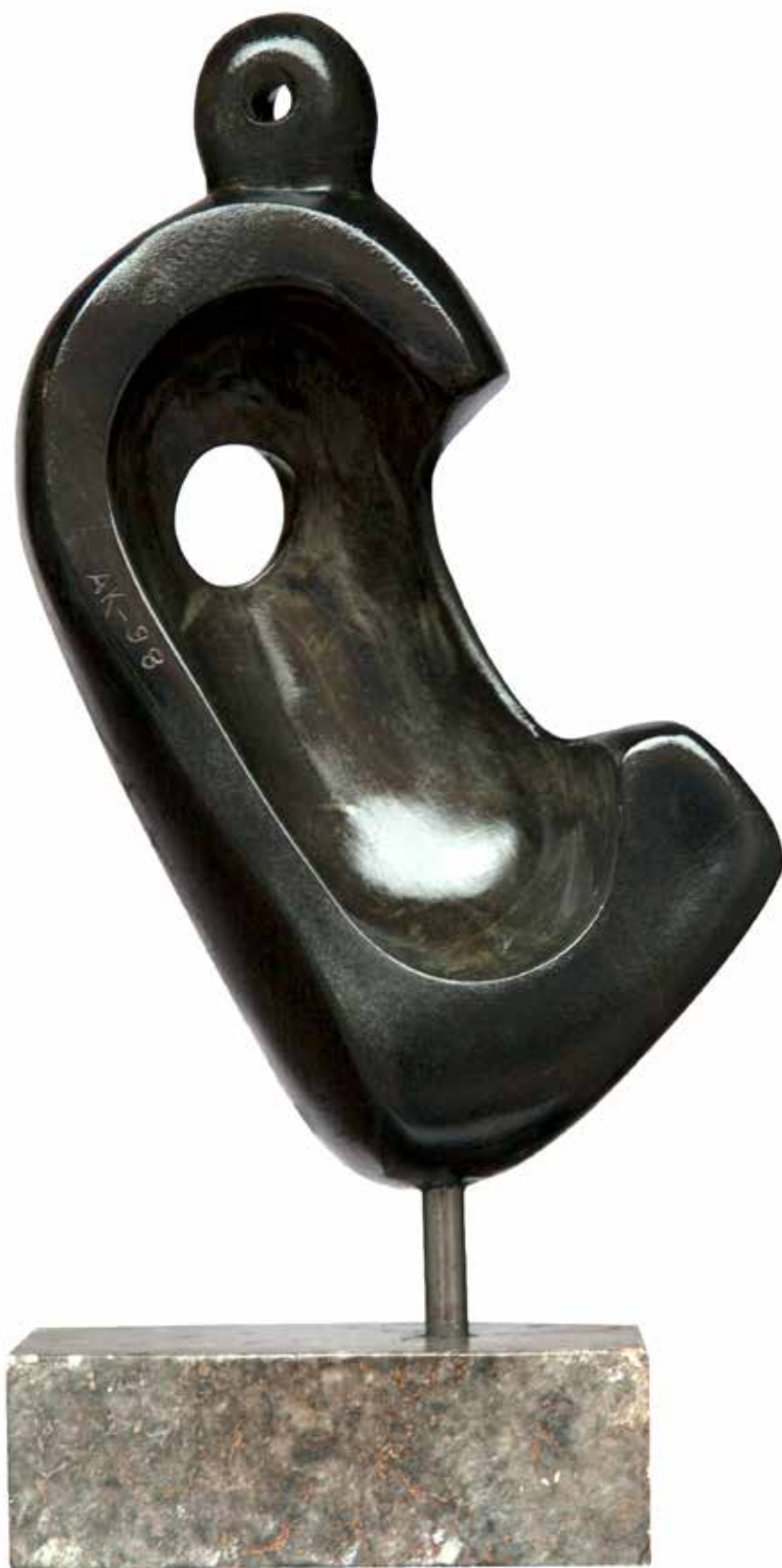
"Kalpteki Ay", 57 x 16 x 21 cm, Serpantin, 1998