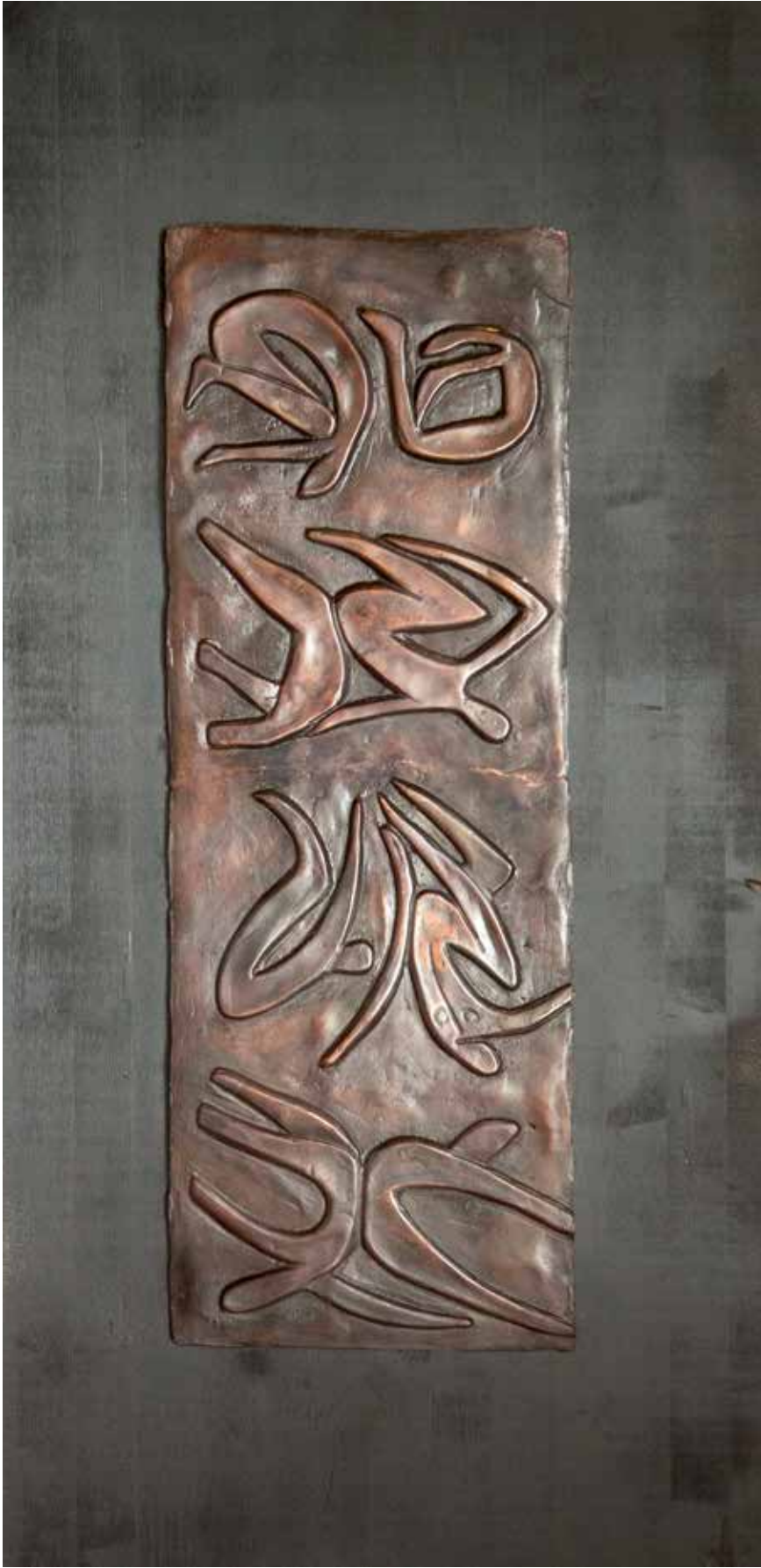
“Rölyepler II”, 120 x 60 x 4 cm, Bronz-Ahşap, 2016