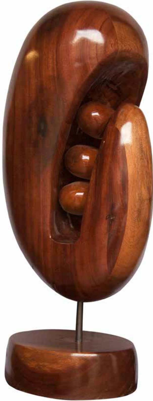
“İç Oluşum”, 84 x 38 x 28 cm, Maun, 2014