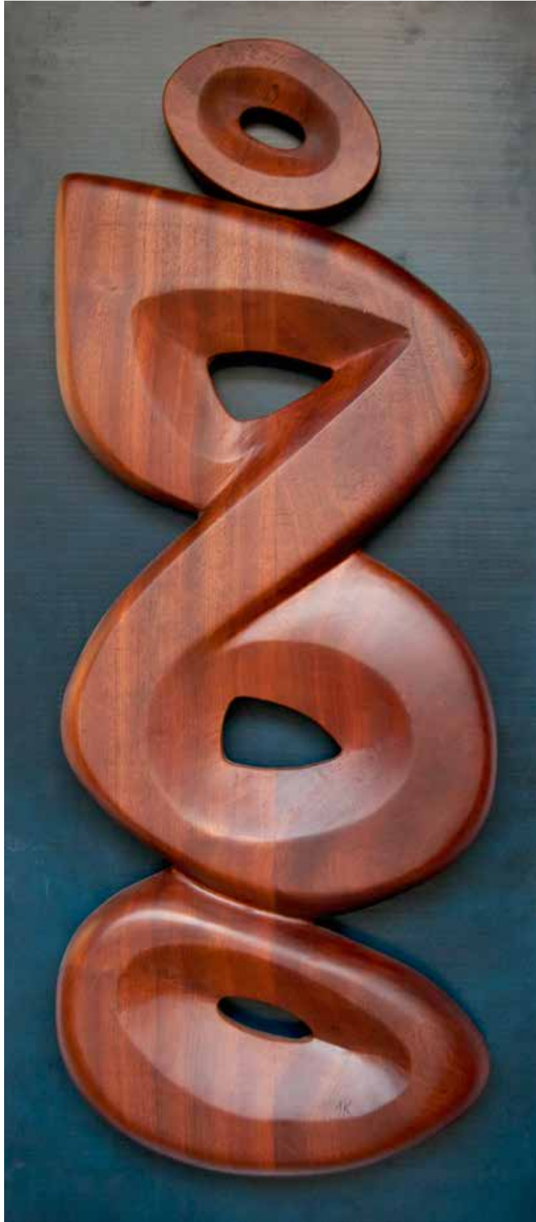
“İç Boşluklar”, 135 x 60 x 14 cm, Maun Pano, 2013